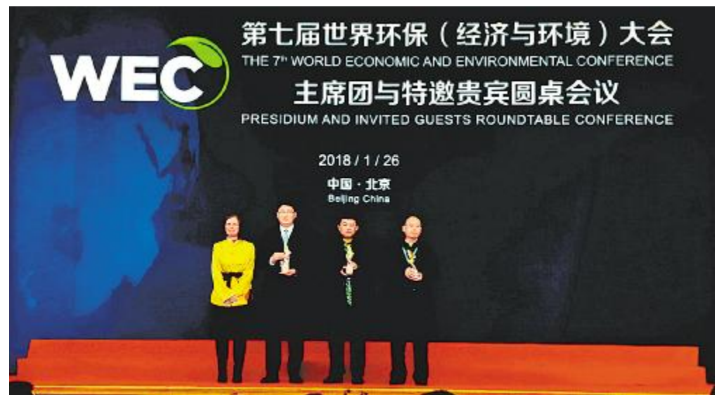
通威太阳能精彩亮相第七届世界环保(经济与环境)大会

标和人才结构等方面的综合评估。这一殊荣的获得,是对公司研发和技术创新能力的充分肯定,更是对公司持续发展的一种鞭策和激励。未来,通威太阳能将朝着“全力打造世界级太阳能光伏企业和世界级清洁能源公司”的目标不断砥砺前行!据悉,获得本次“国家高新技术企业”还有阿里巴巴、中铁二局等国内知名企业。