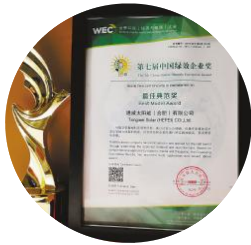
通威太阳能获“中国绿效企业奖·最佳典范奖”

中国绿色低碳发展、取得绿色效益的发展型企业进行评选,通过专家评审、社会调研、调查问卷等严格的评选环节,选出对以低碳理念履行社会责任的最佳表现者。作为中国新能源事业的重要推动者,通威太阳能始终践行绿色节能理念,秉承追求卓越、奉献社会的宗旨,在不断追求产品卓越性能及质量的同时,更积极履行作为企业公民的社会责任,注重产品的节能减排和绿色环保。据悉,同期获奖的企业有伊利集团、恒安集团、中国平安等十余家国内知名企业。