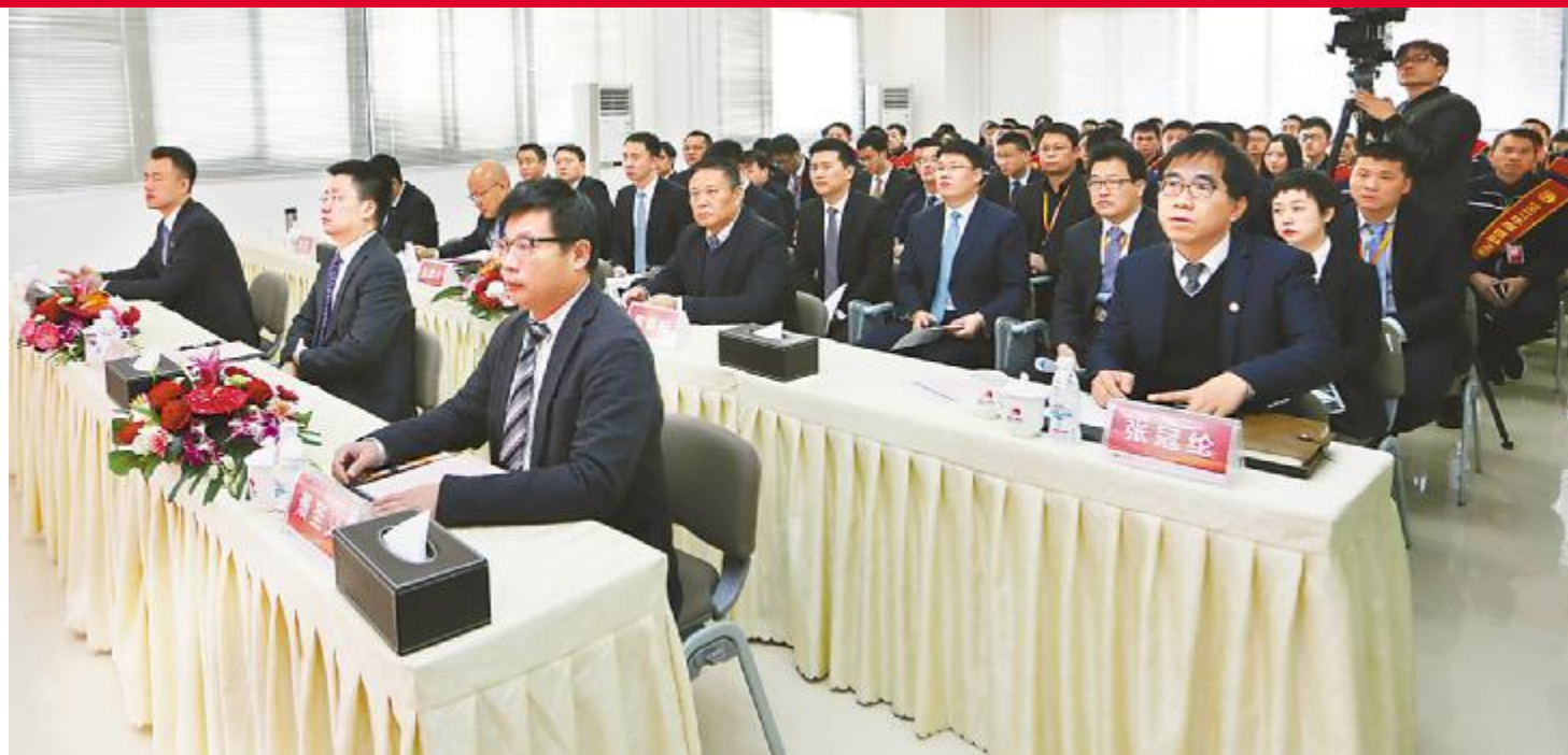
通威太阳能成都公司表彰大会现场