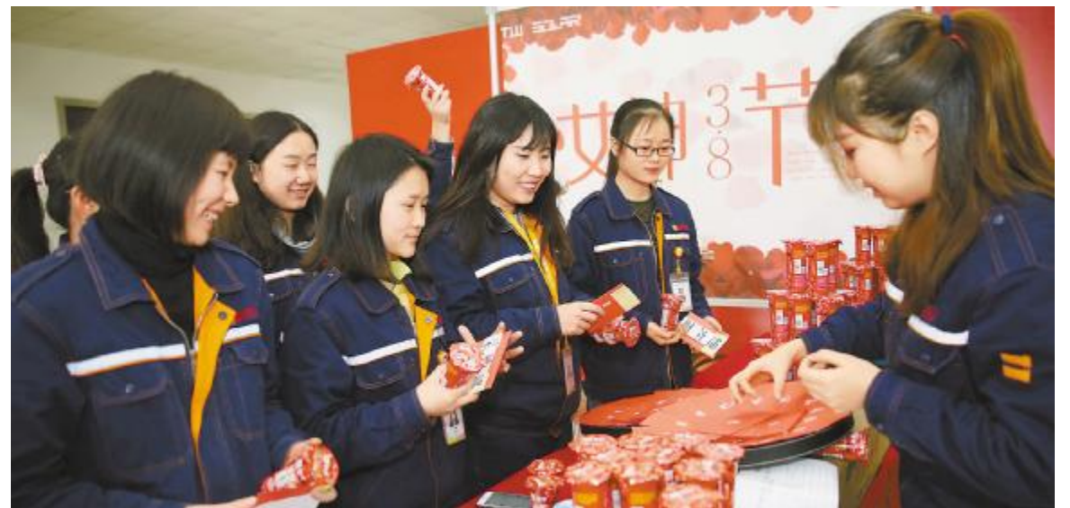
妇女节中,温情满满的礼品派发现场