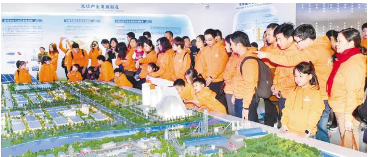
“通威·梦想·家”第三届家庭同乐日活动中,员工及家属参观通威体验中心

在朗读比赛中,102位来自公司各岗位的朗读者们或铿锵激昂、或满怀深情,将无声的文字用真挚的情感诉说。《通威集团企业文化故事集》中的感人故事、《那些年,我们在一起的日子》中的精彩文章都备受选手们的青睐,独具风格的原创作品也在现场赢得阵阵掌声。