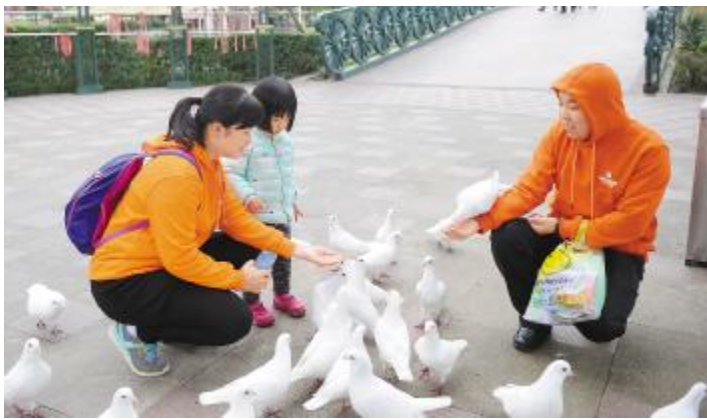
家庭同乐日活动中,员工及家属在国色天香游玩

通威太阳能公司提倡以企为家,高度重视“家”文化建设,积极构建以关爱员工为核心价值的关爱文化,开展了家庭日、员工生日会、家书送祝福、“最美家庭”摄影比赛等一系列活动。