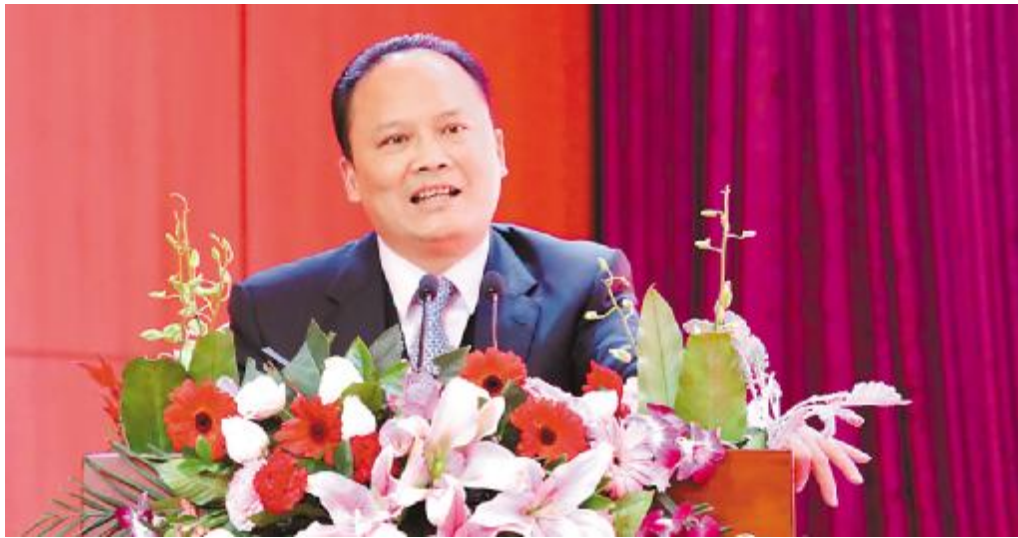
十一届全国政协常委、通威集团董事局刘汉元主席作重要指示