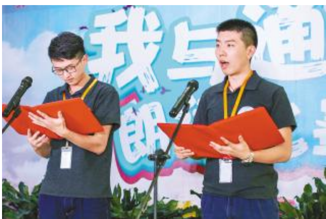
“我与通威”朗读比赛

2017年是建设企业文化2.0时代的关键一年,面临全球光伏市场竞争的新形势、新机遇、新挑战,通威太阳能公司继续发扬把通威文化琢磨透,学好用好的精神,积极开展文化相关活动,对内讲好通威故事,传播好通威文化,凝聚好员工共识。