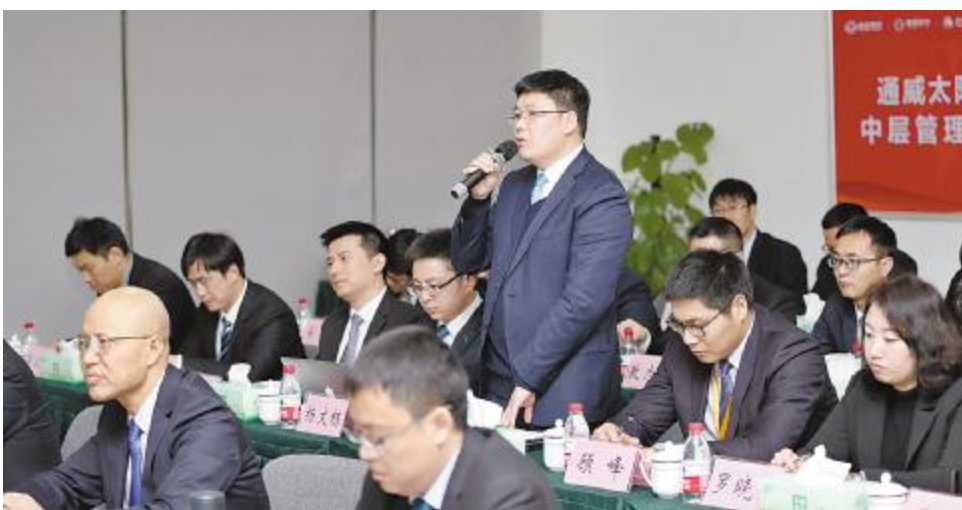
2017年度述职大会现场,管理干部踊跃发言

“2018年大家铆足干劲儿,好好干!”谢董事长勉励大家,面对更加复杂的市场环境,一定要坚定信心,以平稳的心态、昂扬的热情在2018年强化内控,强化管理,从自我做起,以一流的行业水平及高效的管理能力直面更为严峻的挑战!