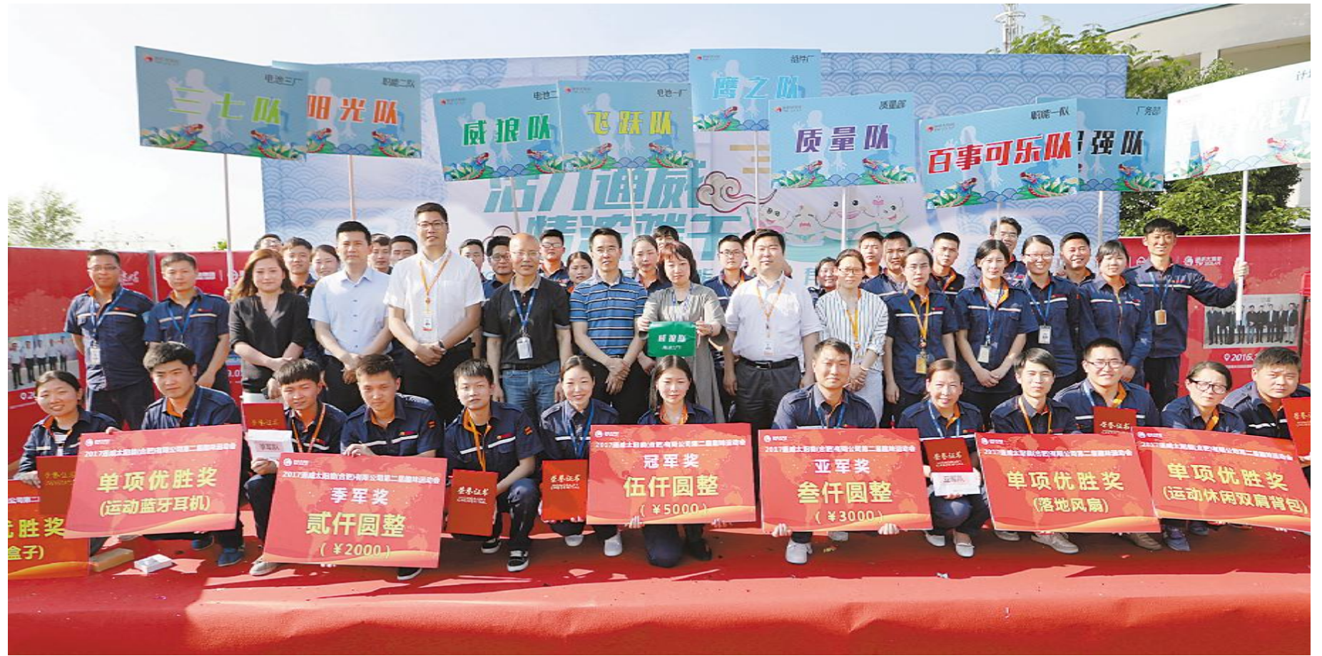
通威太阳能“活力通威 情浓端午”趣味运动会参赛团队合影