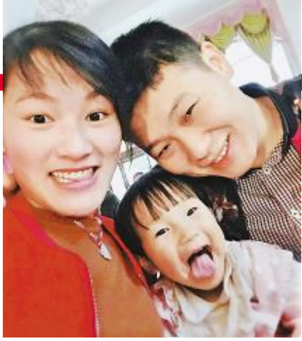
第三届“最美家庭”摄影比赛参赛作品