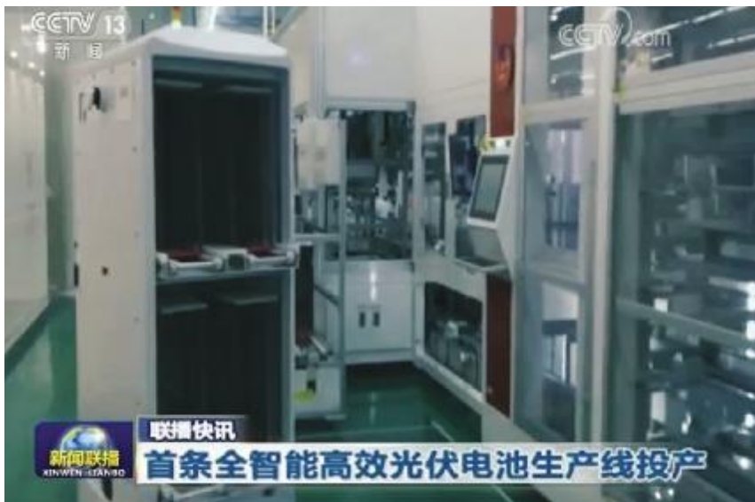
《新闻联播》播出通威太阳能世界首条工业4.0高效电池生产线投产画面