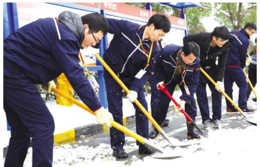
车间人员清扫主干道道路积雪

新年伊始,气温骤降,暴雪侵袭。1月3日,合肥迎来今冬首次突降大雪,23日至25日受冷空气影响,安徽省平均气温直降6-8℃,雨雪天气再杀“回马枪”,一时间各种险情接踵而至。通威太阳能合肥公司“以雪为令、闻雪而动”,在此期间迅速启动应急预案,全厂各部门众志成城,打响“抗雪战役”,全力迎战强降雪确保安全生产。