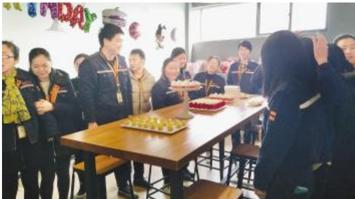
2017年员工生日会活动

通过以“家”文化建设系列活动,员工在家人团聚、共享天伦的同时,通威的家人们也进一步了解了通威的发展和亲人工作的意义,提升了员工的归属感,增强了从员工“小家庭”到通威“大家庭”的凝聚力,为公司发展提供有力的精神动力和文化支撑。有了通威家人们的坚强后盾与支持,通威太阳能在未来的发展中必将再创辉煌。