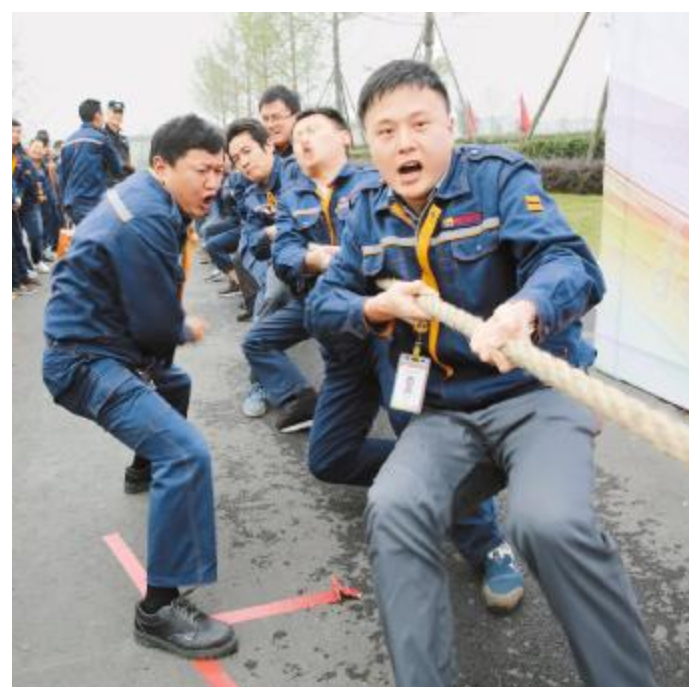
拔河比赛中,员工们斗志昂扬

今年以来,通威太阳能相继开展了“我与通威”朗读比赛、拔河比赛、篮球友谊赛以及沙拉、月饼试吃等活动,为员工提供了相互交流与竞技的平台,展现自我风采的机会,丰富了员工的业余生活,增强了员工凝聚力与责任感。