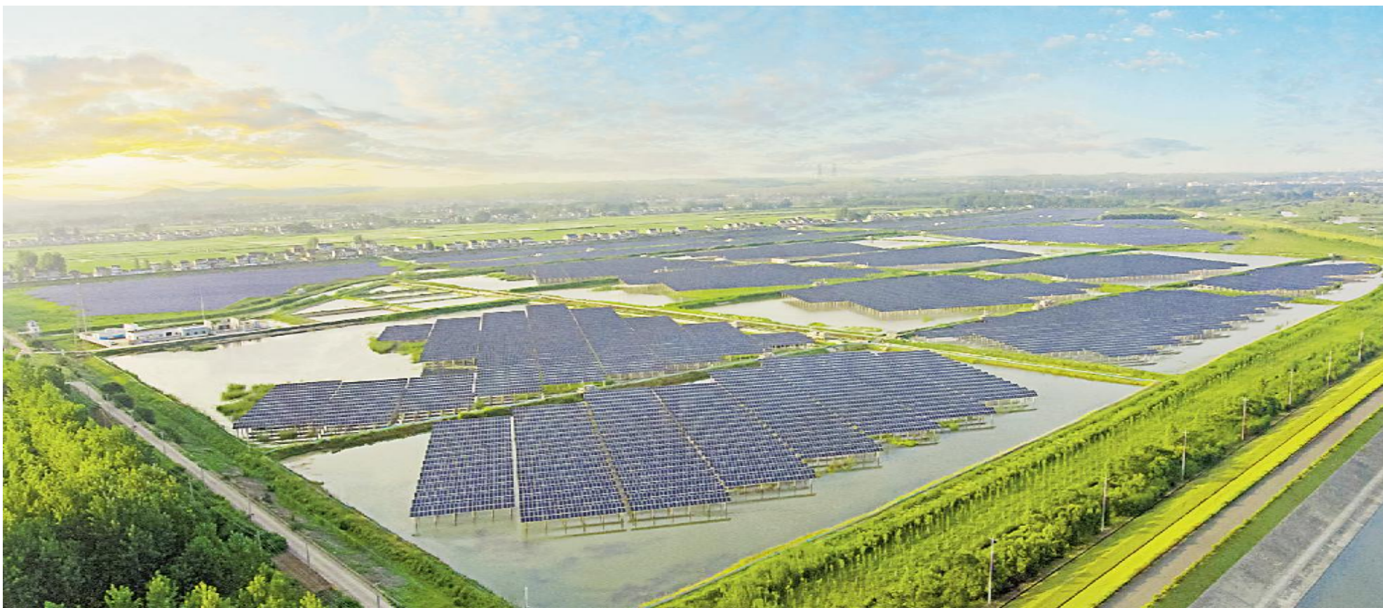
通威龙袍“渔光一体”基地