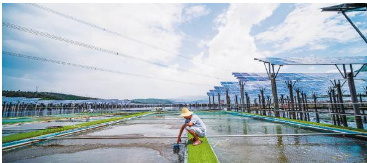
养殖人员在通威西昌“渔光一体”基地内巡塘