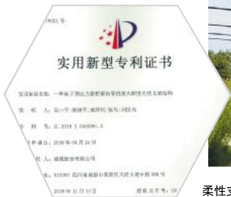
柔性支架V型索系结构