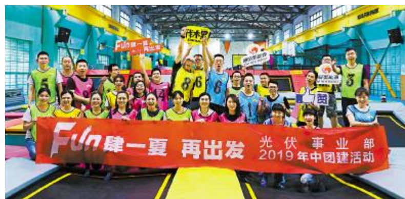
光伏事业部年中团建活动合影留念

7月29日,光伏事业部全体进行了团队建设趣味闯关赛,光伏事业部渔业养殖、投资、工程、技术、采购、运维、市场品牌传播全员上阵,分队进行四个环节的比拼,团队成员不分你我,共同协作,速度PK,每一次的跳跃都记录下了每位成员在努力过程中的正能量,在比赛中的竞技力量,在团队协作中的深刻情谊,彰显了光伏事业部的积极向上的精神。