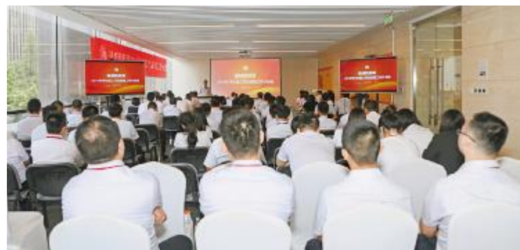
通威新能源有限公司年中工作总结暨计划会

此次年中系列活动是通威新能源2019年上半年的回顾与总结,不仅明确了下半年的工作重点,未来能力所指方向,也是一次团队互融的促进。未来通威新能源会在聚势聚焦、降本增效之路上深耕,为继续齐心协力打造“渔光一体”模式,为实现年底竞价项目顺利并网,平价项目稳步推进,为明年取得更好的成绩而奋勇争先、砥砺前行。