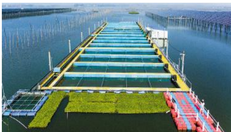
通威泗洪领跑者基地