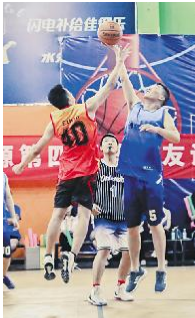
现场你争我抢 气氛热烈