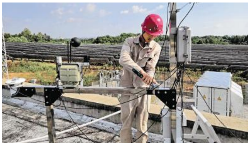
紧固设备螺栓及封堵工作