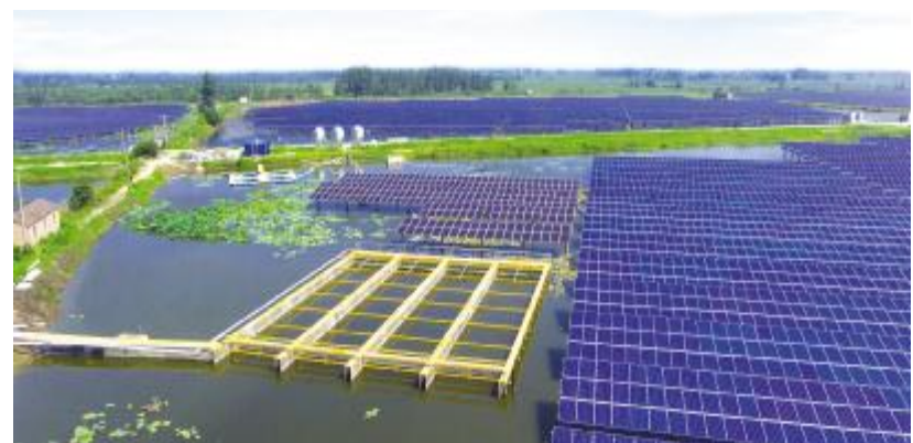
通威和县“渔光一体”基地

西昌基地在8月2日、4日受到两次大雨袭击,水位一夜暴涨40厘米,山洪水大量涌入,水质浑浊,对鲫鱼造成一定影响,引起细菌性病害。通过外用消毒药通威菌毒宁、深典等,内服通威多维、肝胆舒灵、鱼安康等,治疗效果明显。通过通威设施渔业工程研究所2014-2016年研究表明,养殖水面通过架设光伏板,可降低水温1-2℃,对池塘蓝藻有抑制作用。