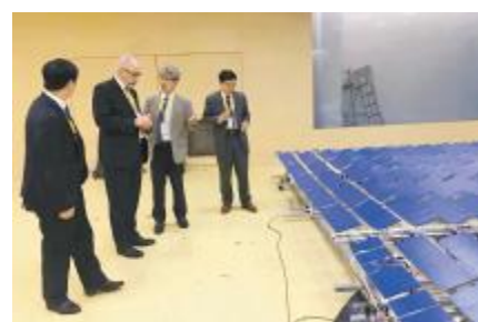
意大利科学院院士点赞柔性支架系统

中国工程院院士、意大利科学院院士对柔性支架当前的设计创新性和新颖性表示肯定,并表示这一设计与桥梁的设计思路对应,创造性的实现了平整的索系结构的搭建,在业内属于首创和领先,今后将在索结构的风荷载响应,风致振动及阻尼响应方面将进一步的交流并予以指导。