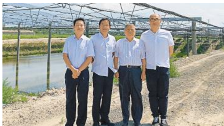
陈政清院士与通威柔性支架系统主创团队合影留念

陈政清院士为中国工程院土木、水利与建筑工程学部院士。长期从事工程力学研究,提出了梁杆索结构三维变形的有限元方法并据此开发出计算程序,为我国现代桥梁建设提供了急需的设计计算理论,对我国悬索桥和斜拉桥的设计计算理论有重大贡献。现场交流过程中,在了解通威“渔光一体”解决方案中索结构的构建及风荷载、抗风强度后,陈院士还详细查看了钢索的载荷设计,了解当前的设计成本。陈院士对当前的设计的创新性和新颖性表示肯定,并表示这一设计与桥梁的设计思路对应,创造性的实现了平整的索系结构的搭建,在业内属于首创和领先,今后将在索结构的风荷载响应,风致振动及阻尼响应方面将进一步的交流并予以指导。