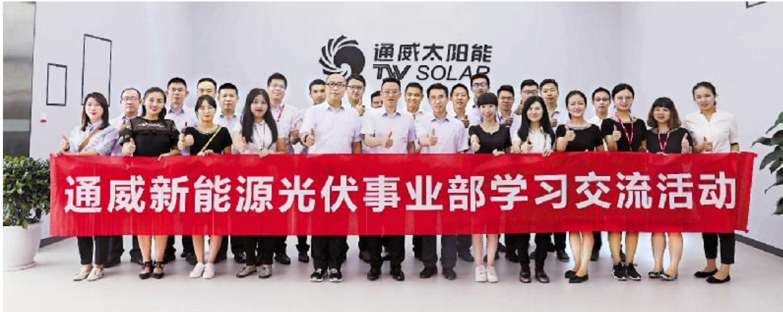
通威股份光伏事业部赴通威太阳能参观学习