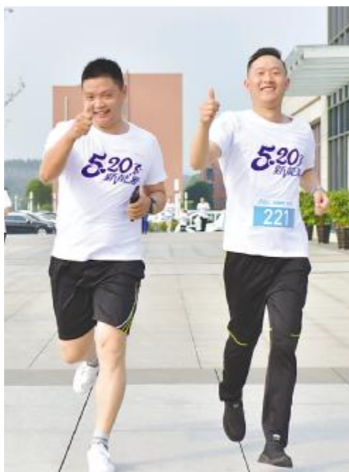
参与员工为活动点赞