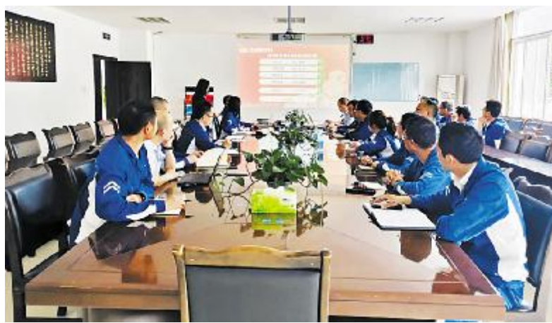
永祥硅材料4月阿米巴经营分析会成功举行