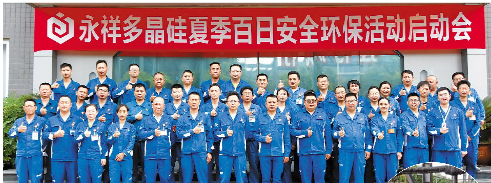
永祥多晶硅组织召开夏季百日安全环保活动启动会

进入5月,气温逐渐升高,“烧烤模式”正式上线。而此阶段,也正是化工企业生产安全事故最高发的季节。夏季炎热高温,容易引起部分易燃易爆挥发的化工原料起火爆炸,也容易导致设备故障和容器老化,造成液体原料滴漏、胀冒的现象,甚至造成容器炸裂,引发爆炸。夏季多雨天气,设备和线路的绝缘性能受到影响,加上雷电风雨的威胁,更容易引发火灾爆炸等事故。为切实做好夏季安全工作,确保公司员工生命安全、财产安全、装置长周期安全稳定运行,防止事故发生,进一步强化全员安全意识,夯实“全面安全管理”基础,不断提升公司安全生产管理水平。5月起,永祥股份各公司相继开展夏季安全环保活动,抓清单、强意识、查隐患、防风险、保安全、促环保,确保公司持续安全稳定运行。