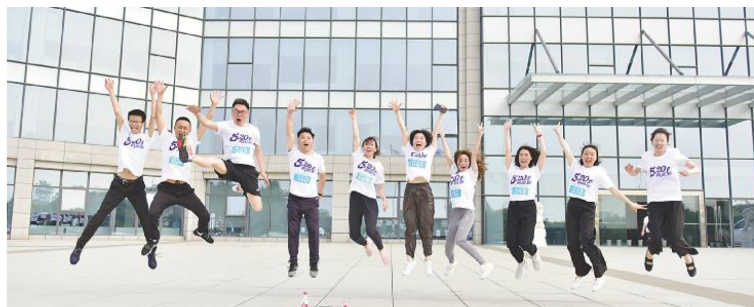
充满活力的永祥人