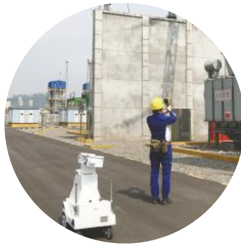
永祥新能源实施人机共同巡检