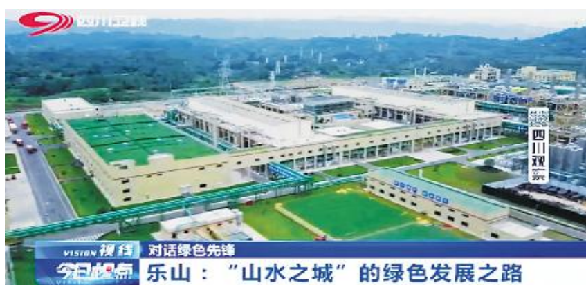
乐山：“山水之城”的绿色发展之路 四川卫视聚焦永祥股份绿色发展

未来,永祥股份将继续坚持绿色发展不动摇,永祥乐山高纯晶硅二期项目也将按照:全新的技术创新、全新的智慧工厂、全新的产品定位、全新的战略定位、全新的核心竞争力,打造智慧工厂、绿色工厂的精品项目。为乐山千亿“绿色硅谷”打造,为治蜀兴川贡献新的积极力量。