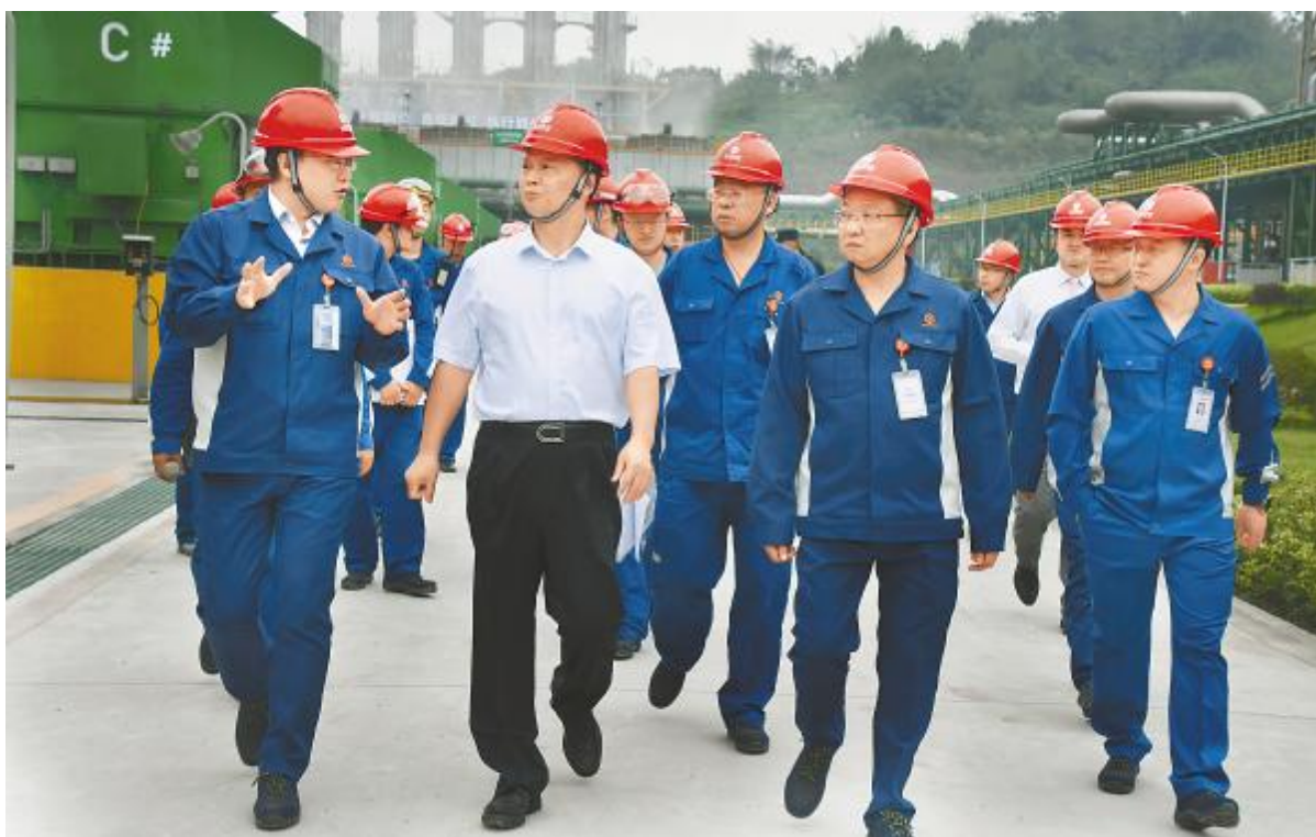
刘汉元主席视察永祥股份厂区

在永祥股份视察期间,刘汉元主席深入各公司和生产车间,听取了相关工程设备管理、生产经营管理、重点设备运行维护管理、氯压机管理等具体举措的汇报,并询问了设备运行情况、检修维修及工艺技术重点。相关负责人介绍了公司标准化提档升级并清单落地、“三级巡检”、设备建造、“三员管控”、设备技术创新等有力措施,向管理要效益后,各项消耗指标、产品质量、设备效率取得显著成效,有力保障了生产装置长周期平稳运行。刘主席对永祥花园式厂区打