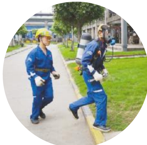
永祥树脂开展专项应急处置演练