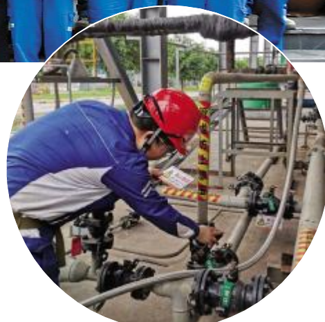
永祥股份管理提升小组开展专项检查