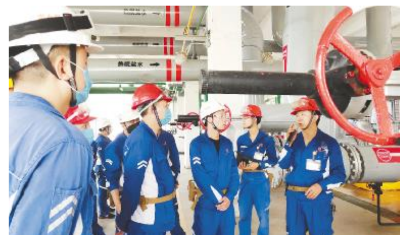
永祥新材料开展TPM观摩学习

培训围绕职业病危害、职业禁忌、职业诊断和鉴定、健康防护等相关知识,向参训人员讲解了职业卫生概述、职业病目录及分类、典型案例、常见职业病种类、常见职业病详述、个人防护、职业健康体检等内容。通过培训,参训员工对工作岗位的有害因素及防治措施有了更全面的了解,增强了自我防护的意识,纷纷表示在工作中将自觉穿戴好防护用品,防止有害因素的伤害,有一个健康的身体,才能更好的工作,才能有一个幸福美满的家庭。