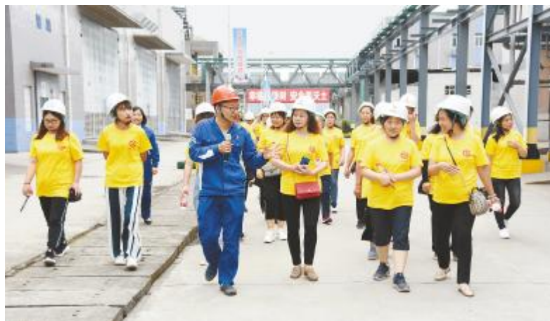
员工家属走进永祥树脂厂区参观