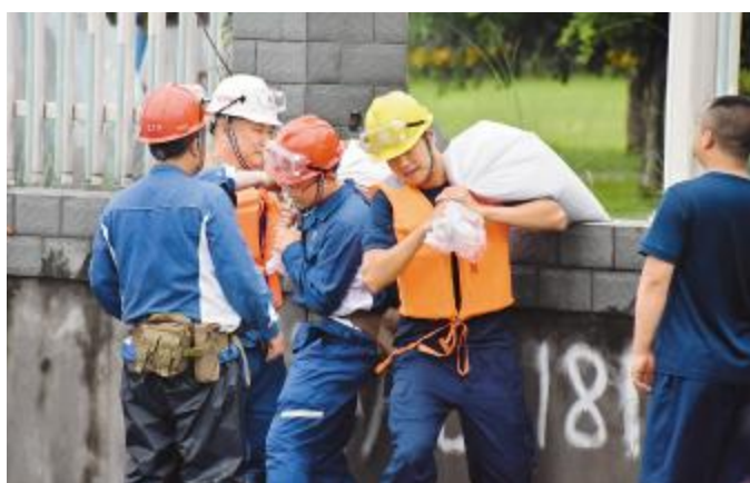
永祥干部员工全员上阵应对洪峰