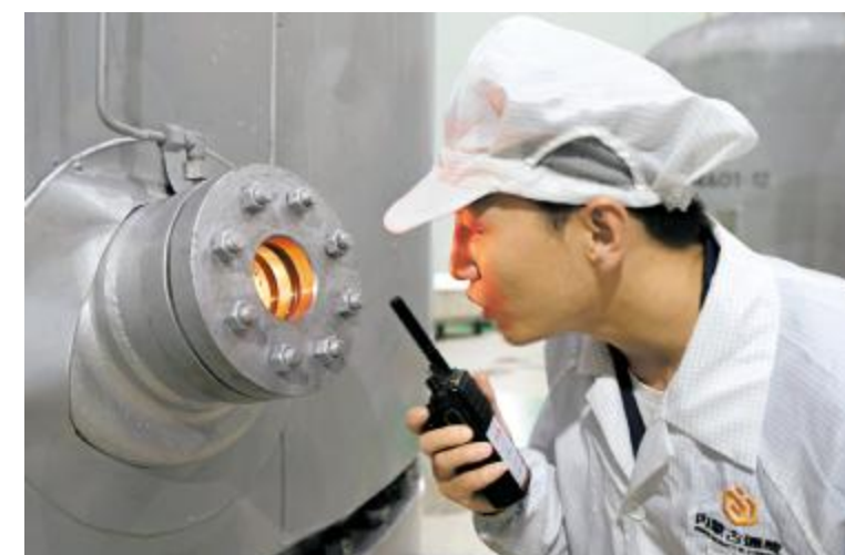
精益求精,时刻关注晶硅生长情况