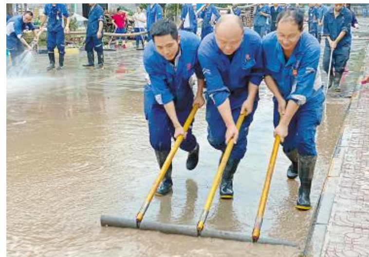
铲淤泥、清垃圾,永祥硅材料员工配合默契,齐心协力,快速将淤泥积水排到下水道。8月22日,永祥硅材料完成了外围清淤作业,保障通道安全畅通,无杂物、无积水。

面对高温、洪水,永祥员工坚守在生产一线,不惧酷暑,奋战在高温天气下。汗水浸湿了他们的工作服,而他们却依然坚守在岗位上,仔细检查着每一个阀门、巡检着每一台设备,全力保障生产装置的安全稳定运行;面对洪水来袭,永祥员工冲锋在前,全员上阵,为抗击洪水筑起坚实城墙。洪水过后,永祥员工立即投入清淤恢复工作,发扬连续奋战精神,不眠不休,不辍不撤。