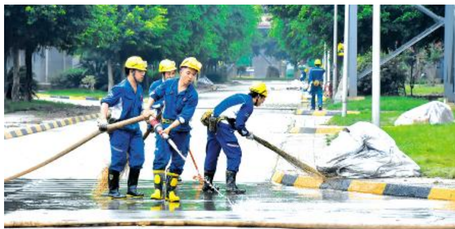
永祥股份员工开展地面清洗工作