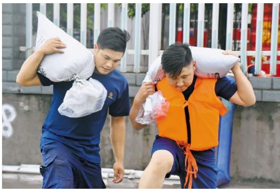
面对最强洪峰过境,永祥新能源消防队员们全力增援老厂区兄弟公司,一起扛沙袋、建防线,冲锋在抢险救灾第一线。