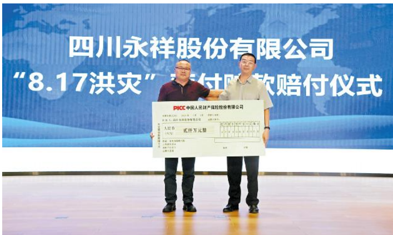
9月2日,中国人民财产保险股份有限公司预付赔款赔付2000万交付永祥,助力永祥灾后复工复产。