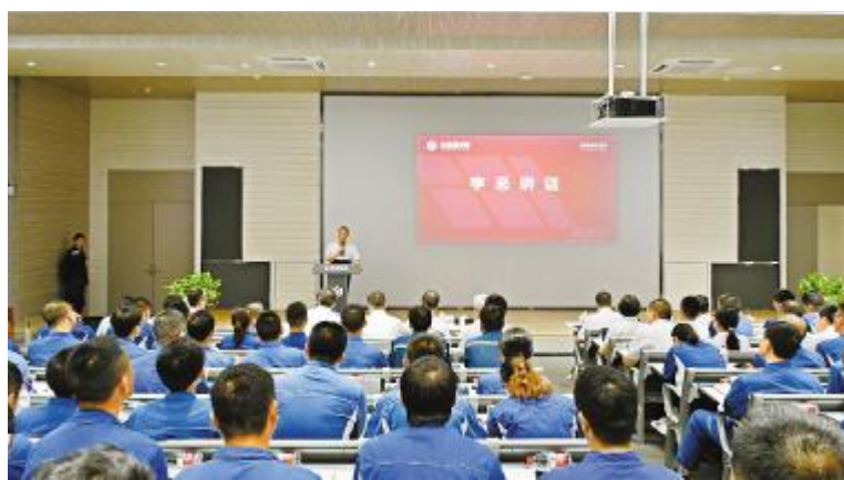
永祥新能源二期项目全体干部员工学习刘汉元主席重要讲话精神