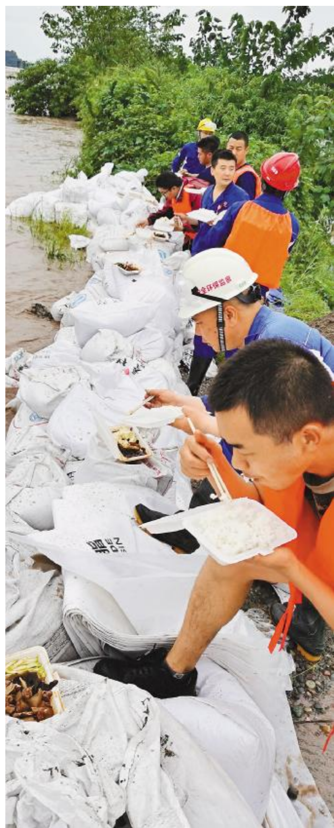
坚守抗洪一线,吃饭也在一线解决