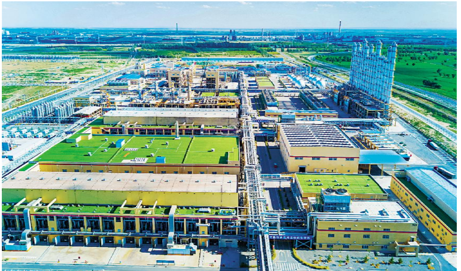
内蒙古通威高纯晶硅绿色厂区

接下来,内蒙古通威高纯晶硅将继续围绕“科技创新、文化引领、双轮驱动、高效经营”的经营方针,以“夯实基础、发力提升、做实一流”的思路开展工作,凝心聚力,勇创佳绩。