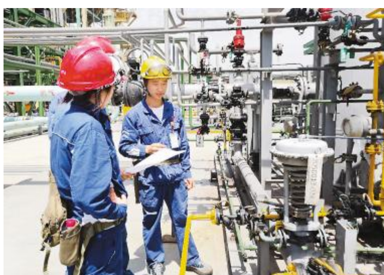
强化安全学习,永祥新能源冷氢化工段对新员工进行实操考试