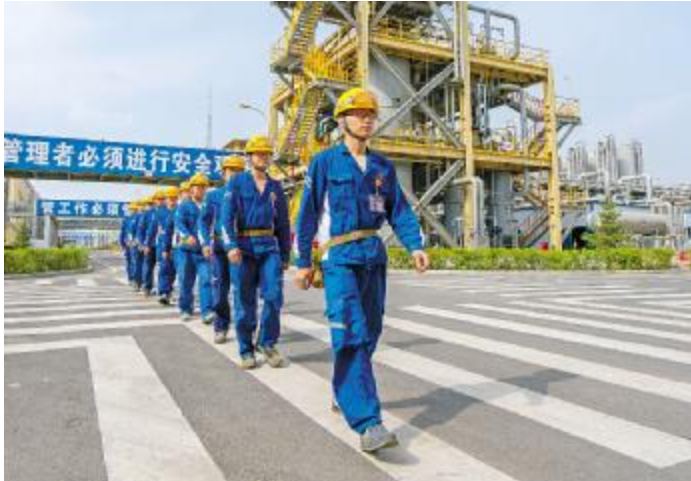
精神饱满的内蒙古通威高纯晶硅员工

8月,对于永祥股份而言是极不平凡的一个月,暴雨、洪灾、酷暑考验着每一个永祥人的意志,面对困难,永祥各公司迎难而上,尤其是位于包头、乐山两地的高纯晶硅项目开足马力,稳产高产,产品质量、各项技术指标保持业内领先水平,实现了尽产尽销。