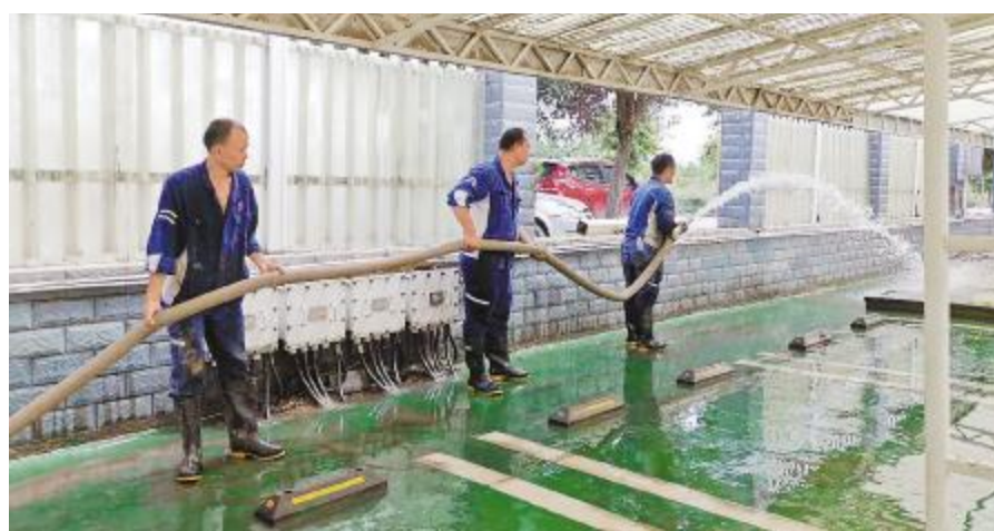
永祥股份各公司积极开展清淤工作