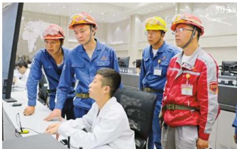
内蒙古通威高纯晶硅开展生产现场JCC审核