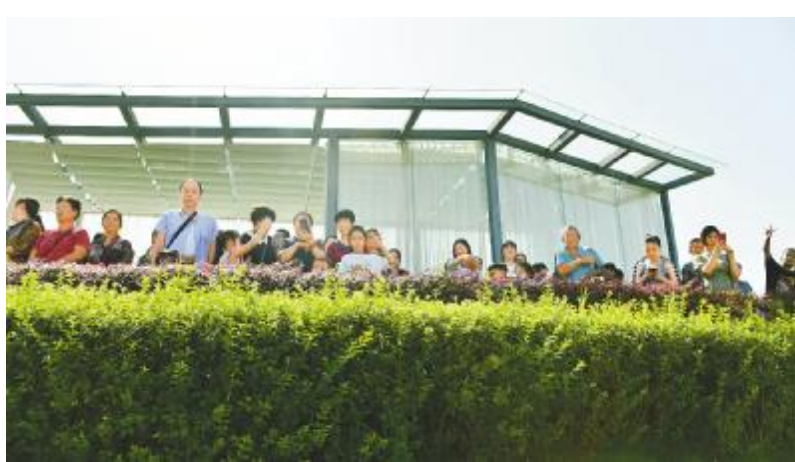
参观团参观永祥绿色工厂

参观团一行深入永祥老厂区,先后参观了永祥树脂离子膜烧碱车间、燃气锅炉装置,永祥多晶硅精馏、还原、变电站、尾气回收等装置区,并环绕永祥新材料公司厂区参观,一路纷纷点头称赞。在“8.18”特大洪水中受灾的三家企业经过短短一周的时间已基本恢复,虽然洪水侵蚀的印记犹在,但在干部职工共