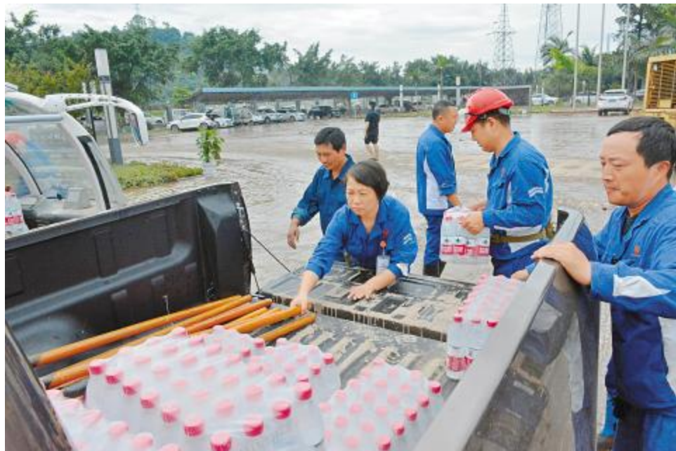
在抗洪救灾过程中,未受灾的永祥新能源积极伸出援助之手,给予兄弟公司大量的人力、物力支持。永祥新能源承担了四家受灾公司用餐供应,先后提供超过16000人次用餐;积极调配用车,为兄弟公司运送各类物资,累计往返各公司近百次。

8月18日,乐山市五通桥区遭遇百年一遇特大洪水,永祥多晶硅、永祥树脂、永祥新材料、永祥硅材料厂区受灾严重。面对困难,有这么一群可亲、可爱、可敬的永祥人,他们坚守一线,不惧酷暑,不惧暴雨与洪水,始终奋战在前!