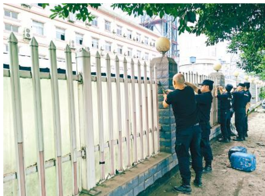
洪水退去后,通宇物业立即从各项目抽调人手,组成支援小组赶到永祥老厂区支援。到达当天即开展对厂区外围损坏围栏的修复,确保厂区安全。

8月18日,乐山市五通桥区遭遇百年一遇特大洪水,永祥多晶硅、永祥树脂、永祥新材料、永祥硅材料厂区受灾严重。面对困难,有这么一群可亲、可爱、可敬的永祥人,他们坚守一线,不惧酷暑,不惧暴雨与洪水,始终奋战在前!