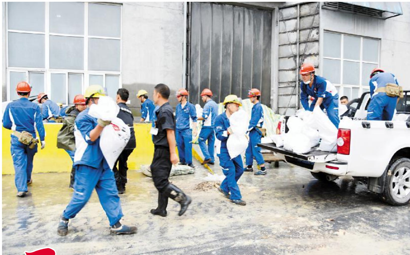
装沙袋、扛沙袋、运沙袋,从8月17日凌晨2点,永祥员工已开始为应对洪峰来袭做好准备。观察河水变化,堆筑防洪沙袋,做好防汛准备。

面对高温、洪水,永祥员工坚守在生产一线,不惧酷暑,奋战在高温天气下。汗水浸湿了他们的工作服,而他们却依然坚守在岗位上,仔细检查着每一个阀门、巡检着每一台设备,全力保障生产装置的安全稳定运行;面对洪水来袭,永祥员工冲锋在前,全员上阵,为抗击洪水筑起坚实城墙。洪水过后,永祥员工立即投入清淤恢复工作,发扬连续奋战精神,不眠不休,不辍不撤。