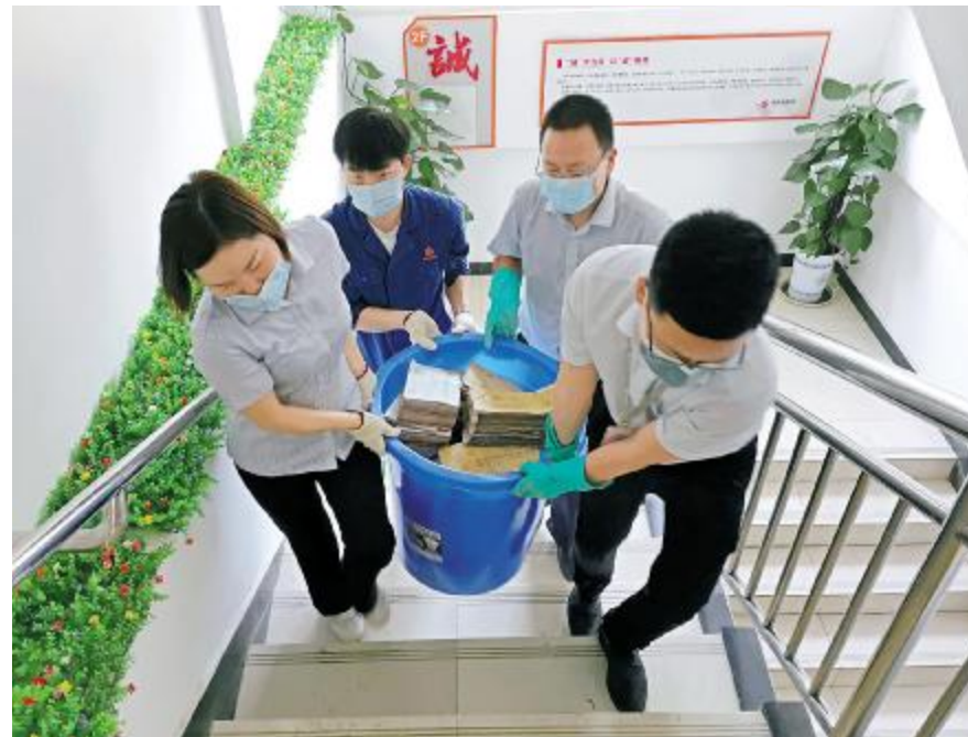
财务中心积极行动,参与抗洪抢险,协助永祥多晶硅等公司转移受灾会计资料,保护重要文件。