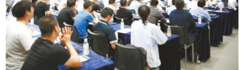
通威太阳能 2020 年供应商培训大会成都基地现场

培训围绕供应商管理的“目的、原则、内容”为核心,对全生命周期管理的相关板块做了系统性、全方位的分析 and 讲解,展示了通威太阳能供应商管理特色。质量部SQE从“管”与“控”的角度,分析了当前通威太阳能质量管理现状,在明确公司质量要求的同时,也提出了各项切实有力的质量保障措施。