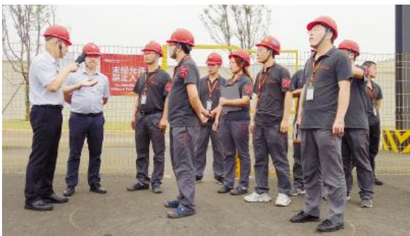
安全检查小组一行对眉山基地特气站进行安全检查

通威太阳能通过开展系列安全文化主题活动,引导全员牢固树立“安全第一”的思想意识,有效提升员工安全素养、安全技能,确保基地安全生产,减少或杜绝安全生产事故的发生。通威太阳能还将继续深入开展各项安全文化主题活动,强化安全管理,有效形成群策群力、齐抓共管的安全工作氛围。