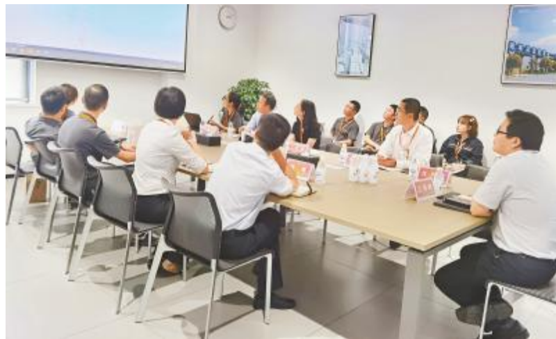
眉山基地标准化建设推广会议现场

的必经之路,推进标准化不仅能指导新人快速融入公司,还能提高部门人员梯队的建设速度,对公司的发展起到至关重要的作用。他强调,生产体系各部门在编制标准化手册时应注重细节与完整性,使其发挥指导作用与提升管理的重要作用。随着公司规模不断扩大,技术和分工的要求越来越高,生产协作越来越广泛,面对挑战,通威太阳能眉山基地在稳步推进生产的同时积极在管理上寻求突破,以期达到各部门各岗位快速上手、避免出错的目的,为生产爬坡夯实基础、做好辅助。