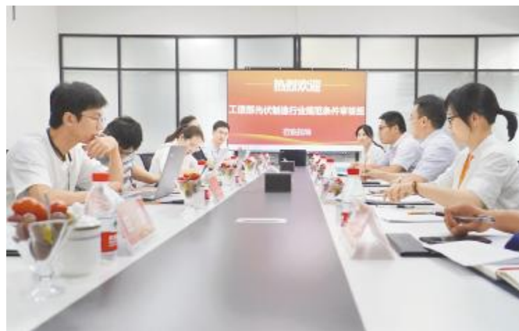
合肥基地工信部《光伏制造行业规范条件》评审现场