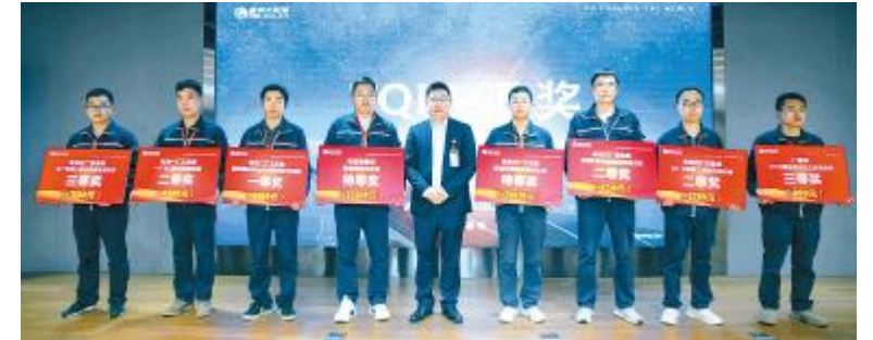
成都基地质量月颁奖仪式现场

通过本次质量方针再宣贯及多层次、多形式质量月活动的开展,通威太阳能从上至下,都充分体现出通威人对质量的卓越追求和在质量强国梦的路上从未停止的步伐。未来,通威太阳能将持续响应国家质量发展纲要号召,深入学习贯彻落实通威集团董事局刘汉元主席关于质量方针要求,大力弘扬质量文化,为保卫蓝天白云,绿水青山贡献力量。