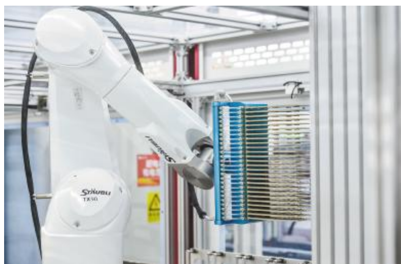
通威太阳能智能制造生产线,大幅提升生产效率,大幅降低能源消耗

近日,国家工业和信息化部节能与综合利用司发布了《第五批绿色制造名单公示》,通威太阳能成都基地荣列榜单,成为此次四川省唯一一家入选国家绿色供应链管理企业。