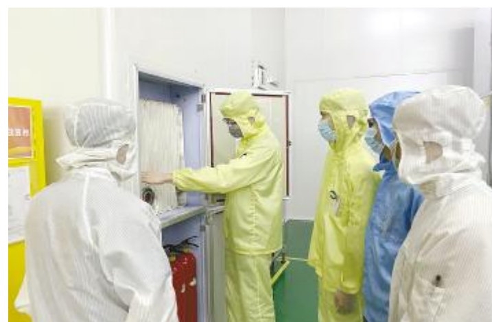
成都基地电池二厂开展消防应急处理培训

9月4日,成都基地电池一厂组织开展了职业病防治基础培训。培训讲解了职业病种类,在生产过程中可能引起职业病的因素、相关职业禁忌、职业病危害因素侵入人体的途径、预防职业病的措施等内容,并结合车间现场可能存在的危险因素分析,实际操作防护措施和个人劳保用品的穿戴,提高了员工的职业病防护意识。