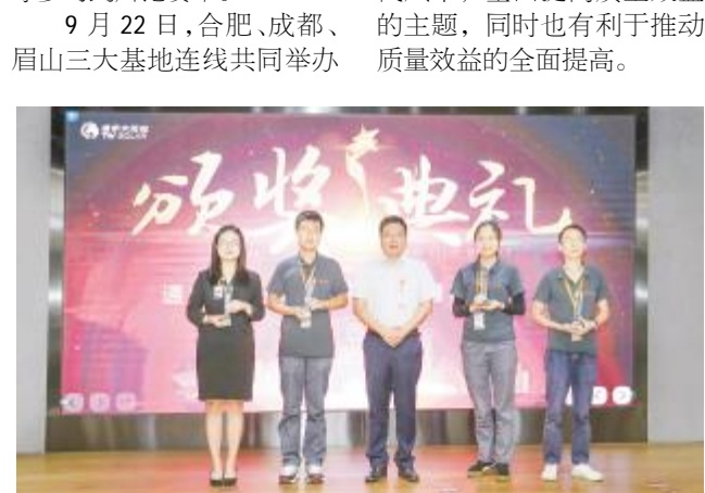
成都基地质量月辩论赛合影留念

9月22日,合肥、成都、眉山三大基地连线共同举办“筑通威盾牌,造光伏卫士”第十八期文化沙龙,沙龙邀请到合肥和成都基地辩论赛选手,两队选手围绕“质量管理中执行力和决策力哪个更重要”展开辩论。