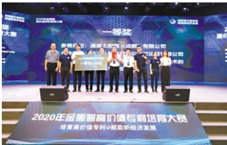
成都基地荣获“金熊猫”高价值专利培育大赛一等奖