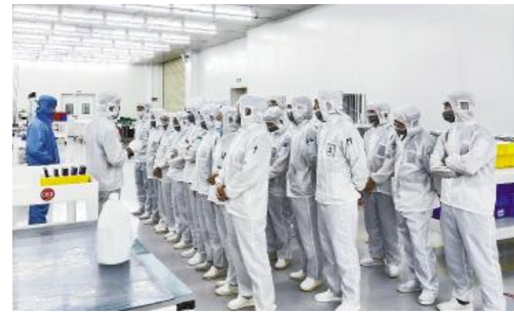
成都基地电池四厂开展机台操作安全培训

患、风险点,及时制定相应的整改措施,消除隐患和危险因素;防止和减少事故的发生,进一步保证了企业安全生产。