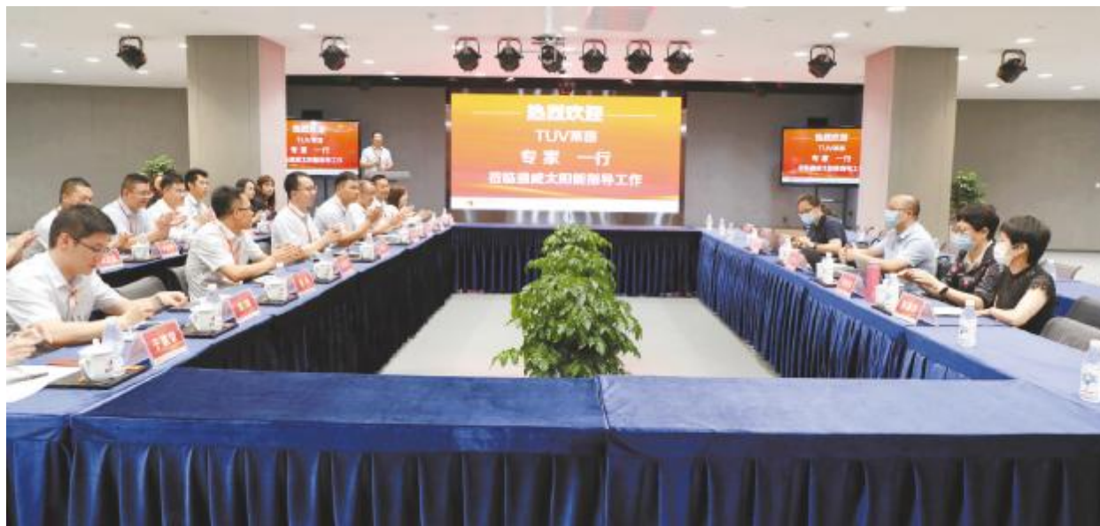
成都基地2020年三标一体管理体系审核现场