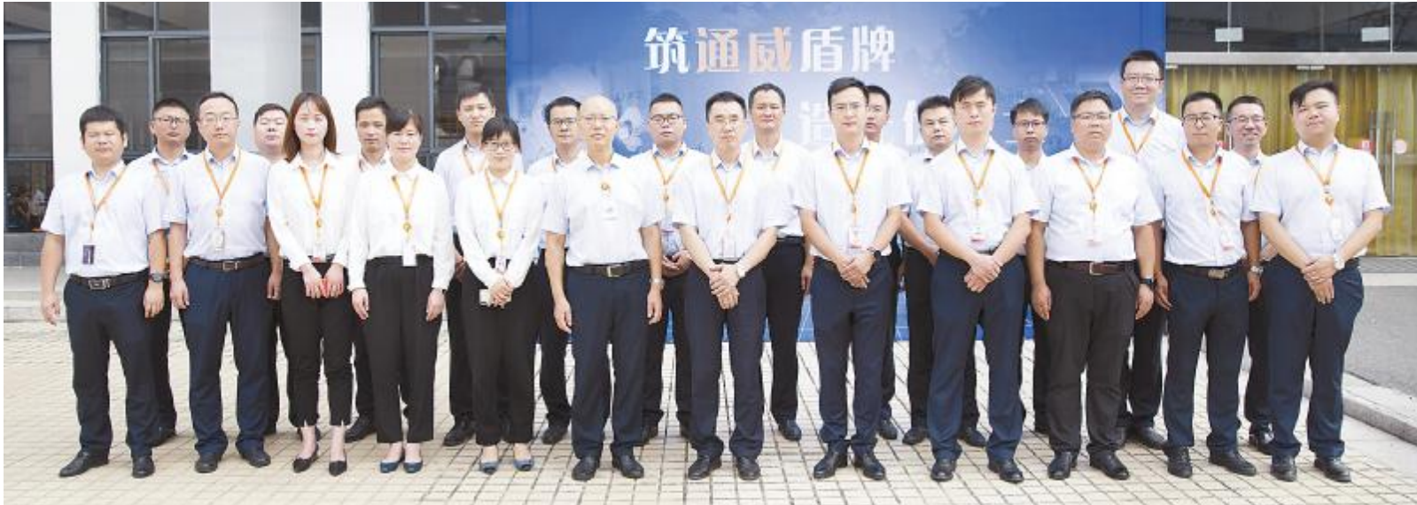
合肥基地 2020 年质量月活动启动仪式现场