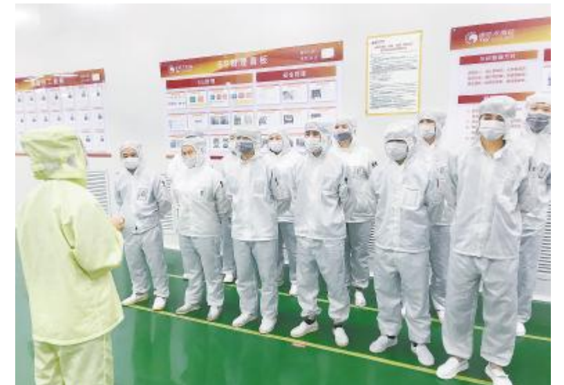
成都基地电池三厂开展员工标准化作业培训

会议强调,为更好的推进安全环保工作,对各部门安全环保工作进行规划和部署,由各部门安全员和6S小组成员组成稽核小组,全面落实公司的各项安全检查工作,对于整个车间的所有区域进度不定期检查,提高全员的安全意识和整改问题的能力。