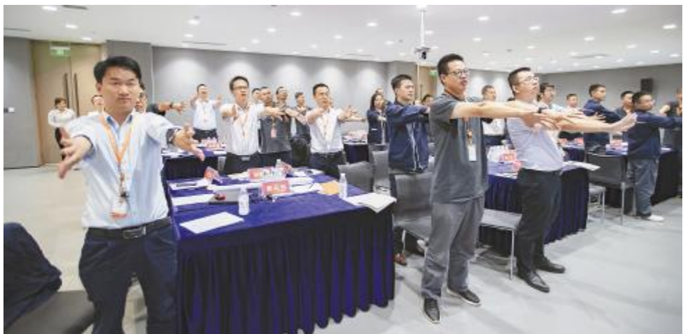
成都基地“质量知识大讲堂”培训现场

跃气氛,其幽默风趣、深入浅出、互动性强的教学模式,营造出了十分浓郁的学习氛围。品质是企业赖以生存的命脉,品质的提升不是一蹴而就的,必须通过持续改进而达到。通过本次培训,不仅提高了学员的质量意识,强化了管理人员质量专业技术水平,为公司进一步推进全面质量管理,提升品牌竞争力,开创精益质量新局面奠定了坚实的基础。