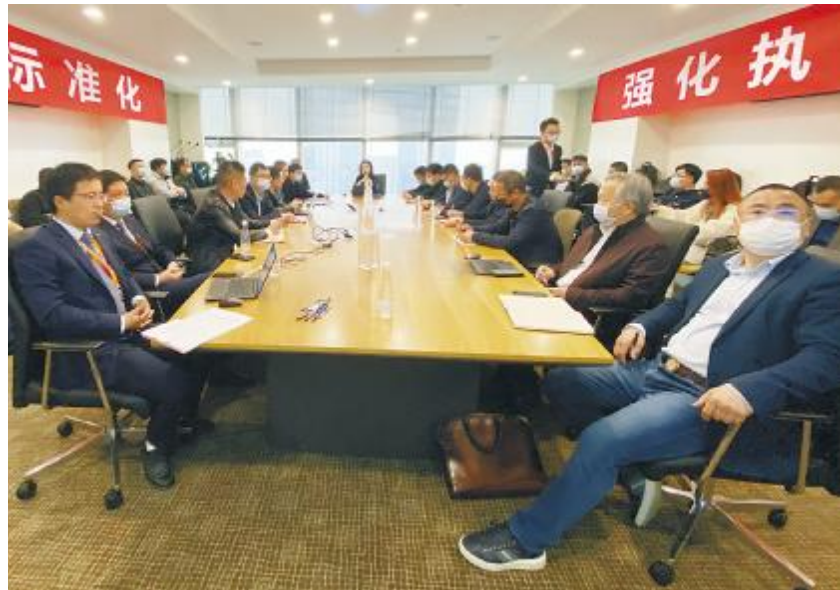
通威新能源举行柔性支架施工培训会

随着业务的拓展,通威新能源在机构当中加入了法律合规概念,成立法律合规组,对所有项目工作的开展进行合规性、合法性审查,并结合实际工作开展法律培训,提升全体干部员工法治意识,培养法治思维,确保所有工作在法治轨道高效运行。