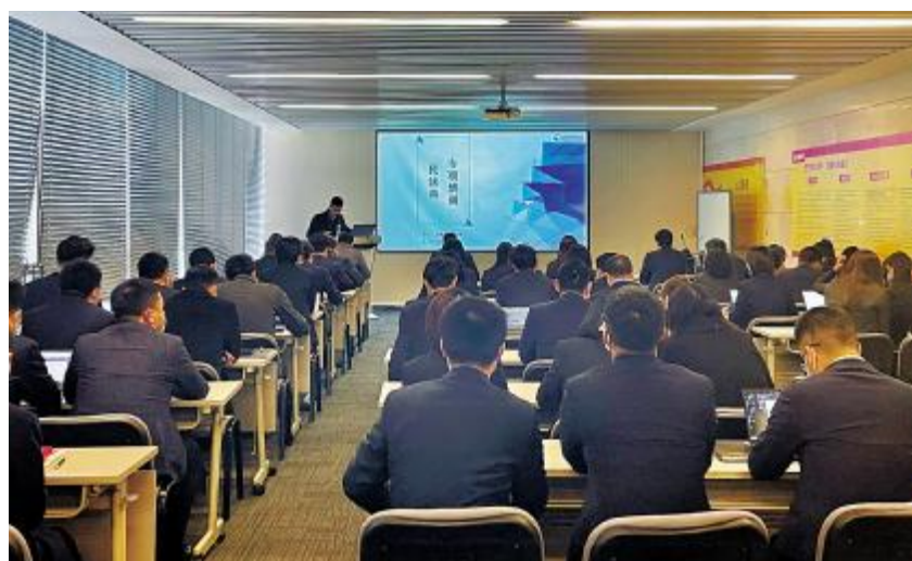
通威新能源开展《民法典》专题法律知识培训

通过汇报前的项目推介预演会和精心准备,在和县项目推介会上,县委书记陈永红听取汇报后,对通威新能源打造“渔光小镇”的专业性给予了高度肯定,希望通威新能源利用好和县资源优势、区位优势,共同打造三新、三农、三产的“渔光小镇”,为和县能源转型、共建和谐生态圈及带动经济产业升级贡献更多力量。