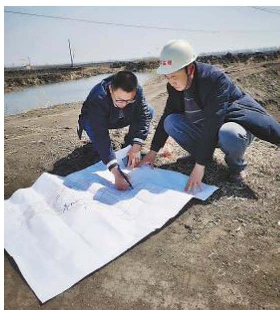
《画日》 文韬 通威新能源人用细腻笔触画出“渔光小镇”蓝图