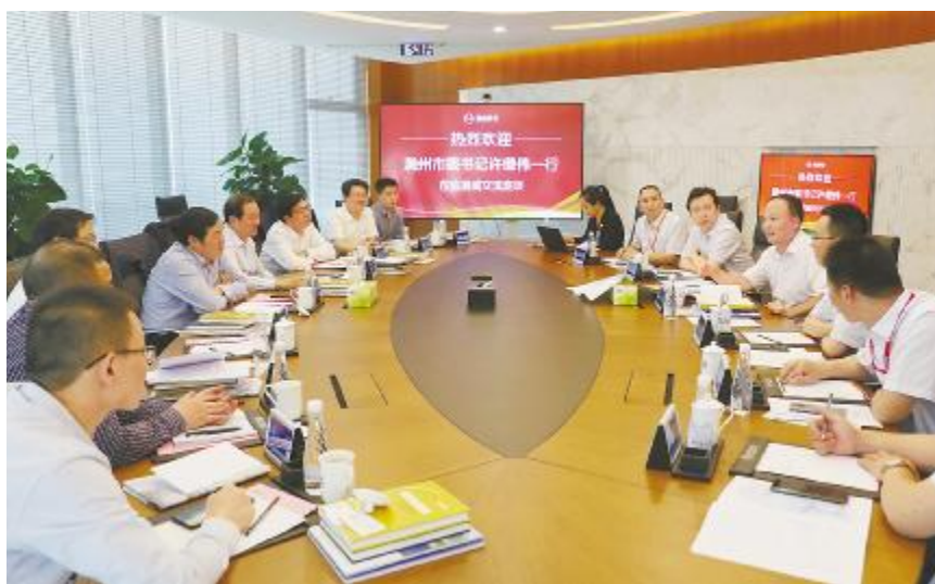
刘汉元主席与滁州市委书记许继伟座谈交流

乡村振兴, 产业振兴是支撑。乡村产业振兴既包括农业的振兴, 也包括乡村二三产业的振兴, 既包括农村传统产业的发展, 也包括农村新产业新业态的发展, 还包括农村一二三产业的相互融合发展。