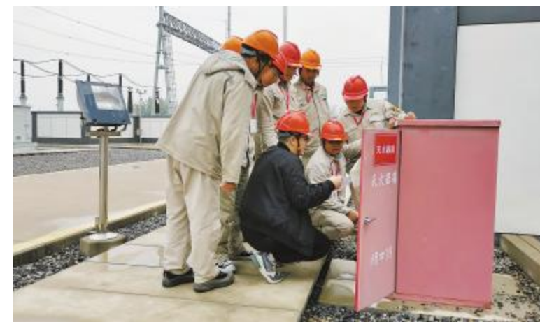
安全标准化建设活动中,基地运维人员排查安全风险点

此外,安全隐患“随手拍”活动、“安全伴我行”征文活动火热进行。以“随手拍”活动为载体,各电站深入开展安全隐患排查工作,对发现的问题,立即整改并及时上报反馈。“安全伴我行”征文活动吸引了广大一线运维人员积极参与,大家结合工作实际,分享了安全生产心得体会,倡导为电站安全运行贡献更多力量。