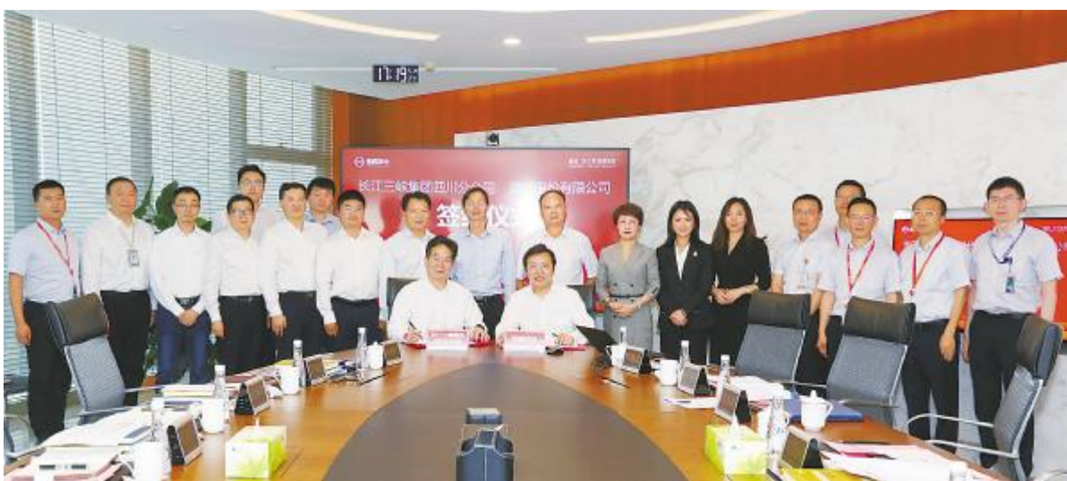
通威股份与三峡集团四川分公司签订战略合作协议