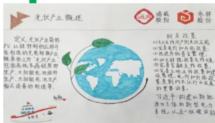
学员手绘海报,展示学习成果