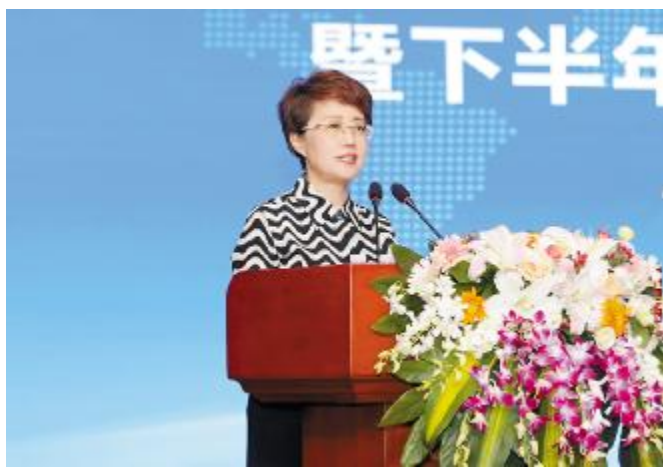
糕玉娇总裁在会上讲话