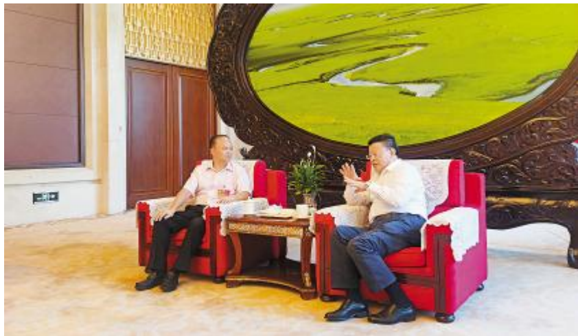
刘汉元主席与孟凡利书记座谈交流