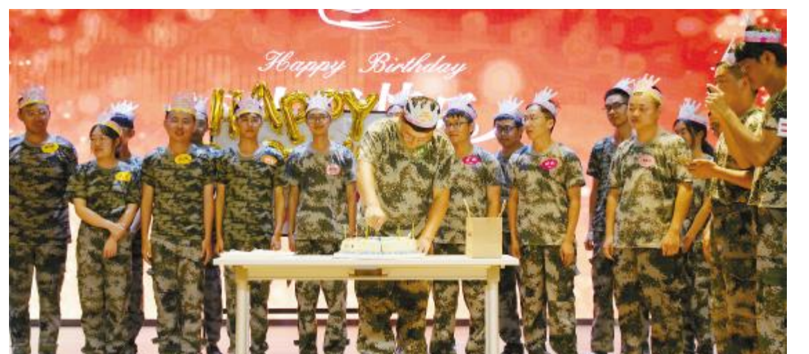
学员生日晚会,感受永祥“家”文化