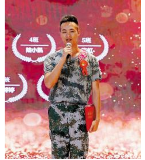
优秀学员分享学习心得