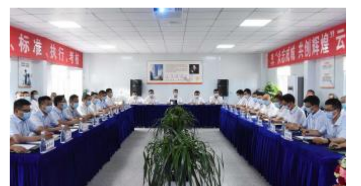
云南通威高纯晶硅公司 2021 半年度总结计划会现场