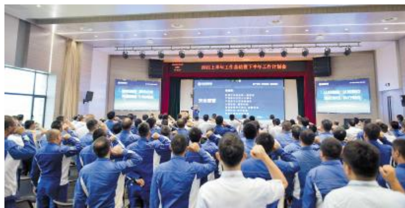
永祥新能源上半年工作总结暨下半年工作计划会上,全员进行安全宣誓