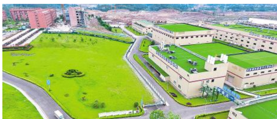
永祥股份花园式工厂

自2002年以来,永祥股份在各级政府和各界帮助、关心支持下稳健发展,实现了企业从无到有,从弱到强。技术、质量、成本指标持续领先,成为全球光伏产业发展的主要参与者和重要推动者,也得到各级媒体的高度关注和认可。迈步“十四五”新征程,永祥将以坚定的信心、饱满的热情,以实际行动推进全球能源革命,为子孙后代留住“青山绿水、白云蓝天”作出不懈努力!