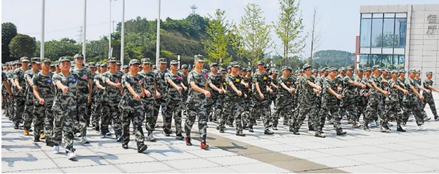
在军训中磨炼意志