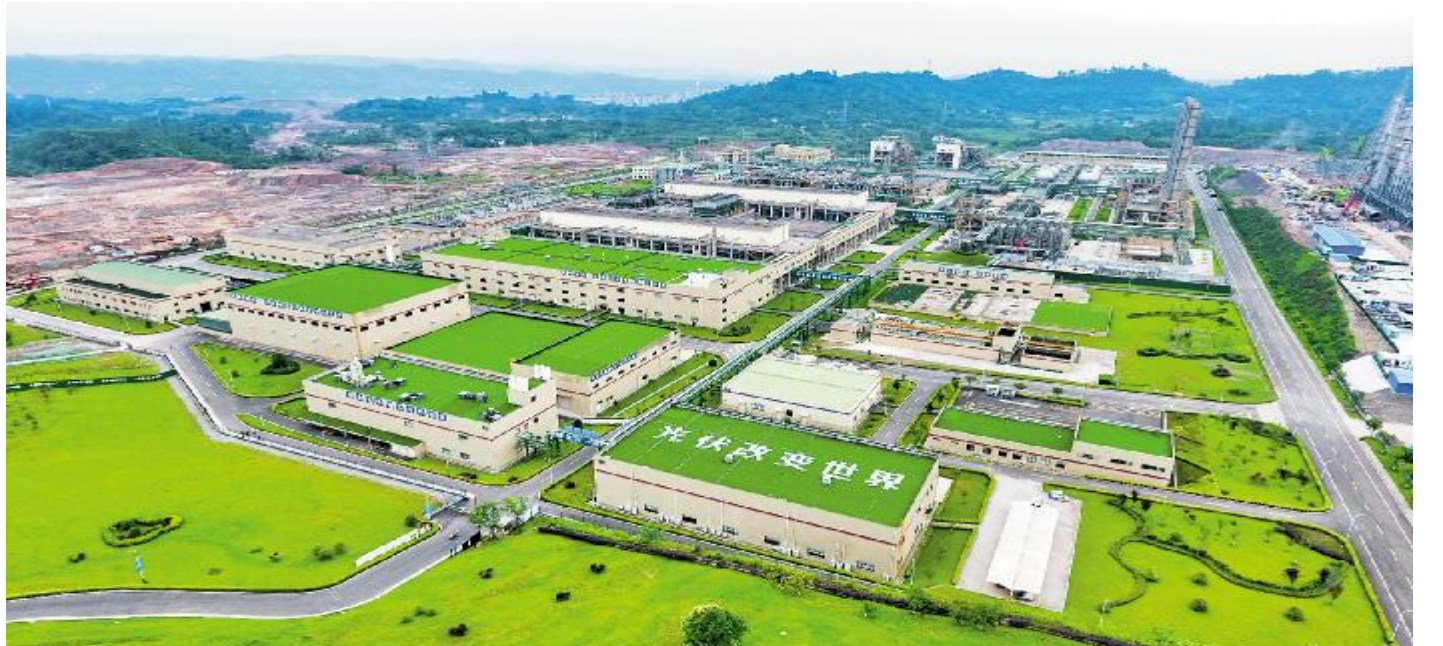
永祥股份花园式工厂

一步考虑生态环境成本,光伏发电的优势将更加明显。加快推进能源消费电力化、电力生产清洁化,加速碳中和进程。通过10到20年时间,实现我国能源增量的70%以上、存量的50%以上的可再生清洁化替代。煤炭的应用可以在我们看得到的30年内接近变成0,石油的应用也可能在30年的时间里面下降到今天20%以下,化石能源的使用几乎将全部退出人类的舞台。 刘主席强调,未来我们的工作将会做得更好,平台也将会更加有力,大家一起共同努力,全球能源转型过程中最浓墨重彩的一笔一定会有通威人、永祥人的历史!