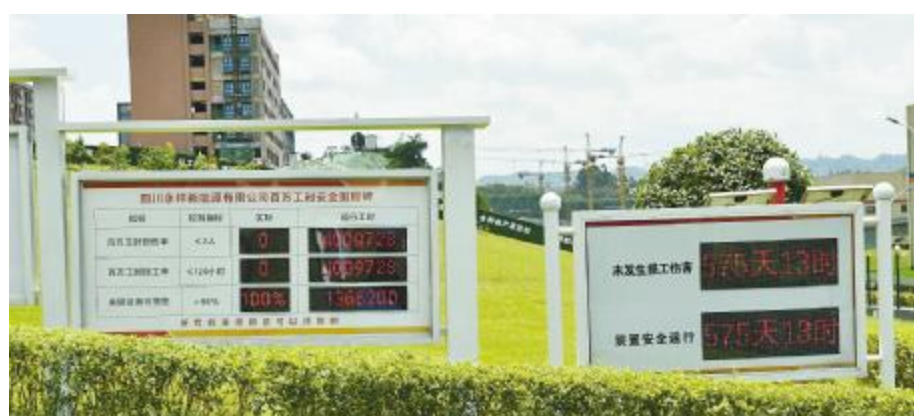
永祥新能源“百万工时”安全里程碑

本报讯(记者 唐黄之 通讯员 郎学延 陈玲)7月12日,永祥新能源累计安全无事故达到575天,再次实现了一个“百万工时”无事故。这也是自2019年12月15日公司推行百万工时安全里程碑管理以来,实现的第四个“100万工时”无事故。