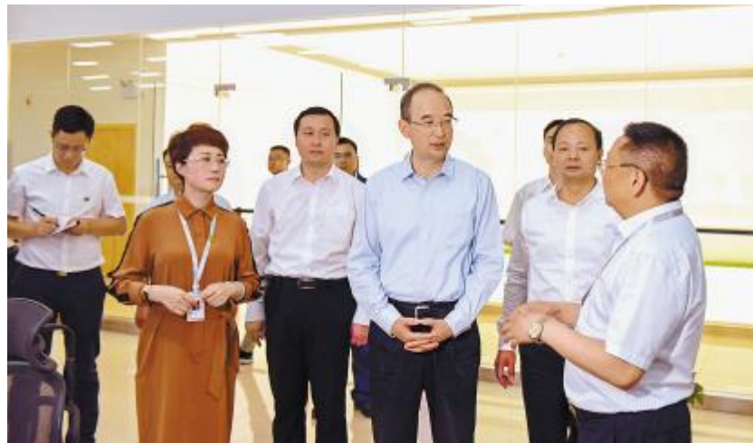
黄强省长听取永祥股份发展情况汇报