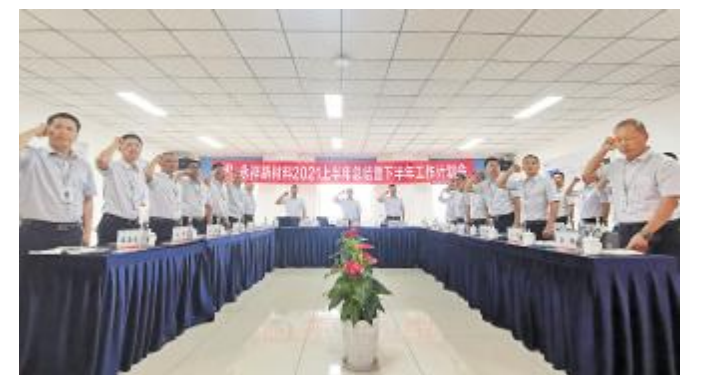
永祥新材料 2021 年上半年工作总结暨下半年计划会前,全员进行安全宣誓