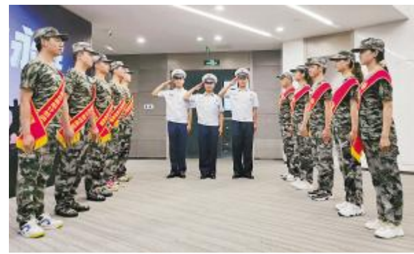
学员进行形象展示