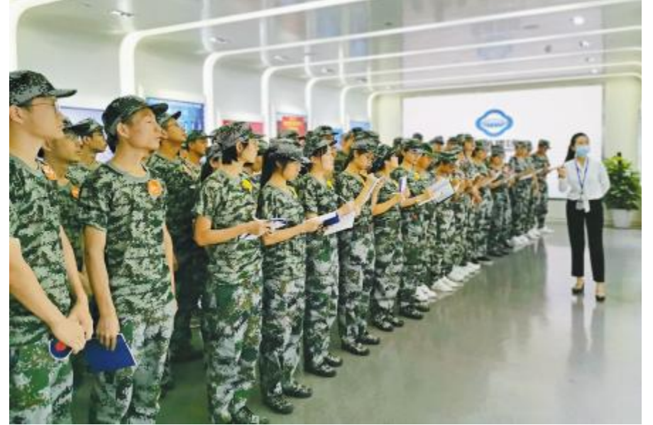
参观通威集团体验中心,了解通威发展史