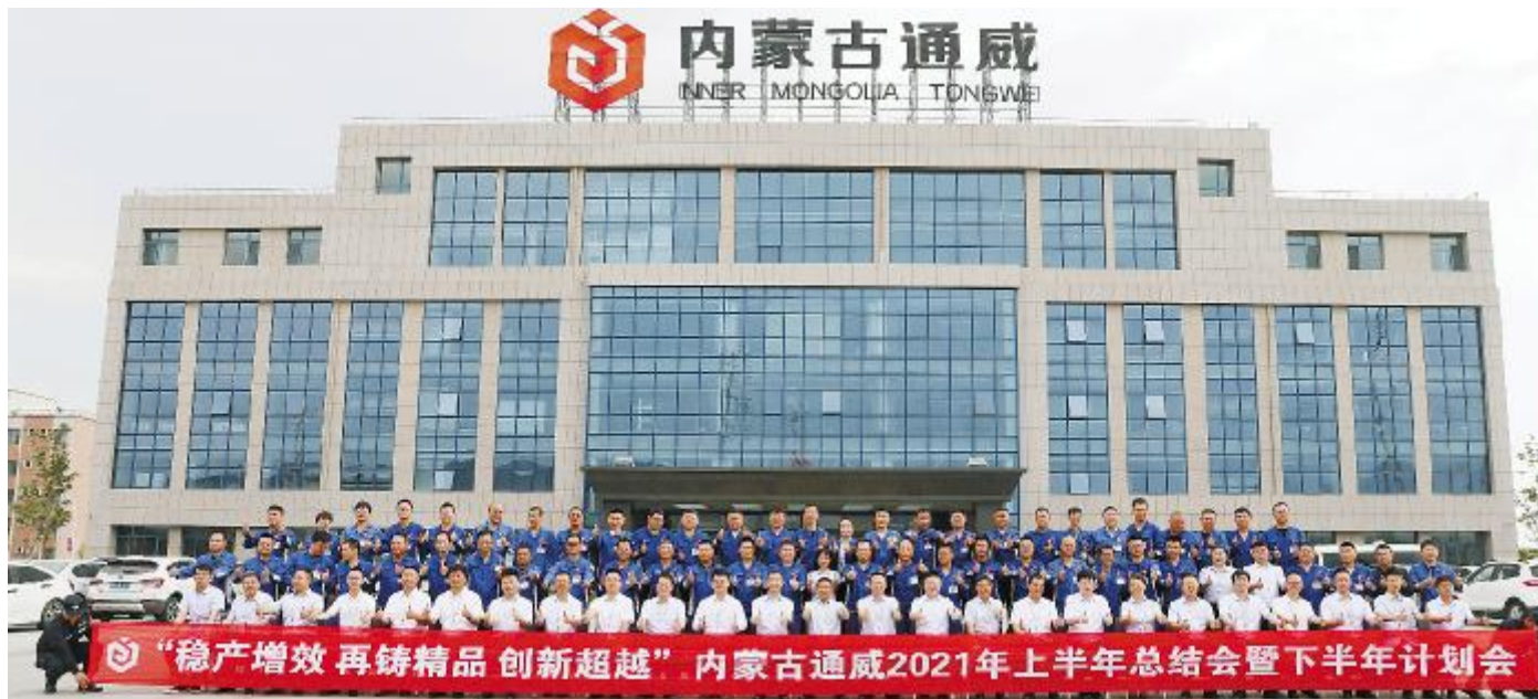
内蒙古通威高纯晶硅公司 2021 年上半年总结会暨下半年计划会合影留念