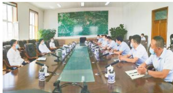
鸡西市委副书记、市长鲁长友与通威新能源考察团座谈交流

通威新能源执行董事兼总经理邱文松率黑龙江区域项目开发负责人前往密山市、鸡西市等地考察,与当地政府部门座谈交流,实地踏勘项目现场,保障项目各项工作顺利推进,推动“渔光小镇”项目在黑龙江落地、大放异彩。