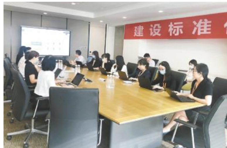
通威新能源人力体系开展岗位价值评估培训

培训期间,大家踊跃提问,对于如何实现公司内外岗位匹配相关问题进行了深入的讨论,培训讲师逐一进行了专业解答。此次培训不仅拓宽了参训人员的视野,还让大家深入了解了对标工作的重要性,更让大家明晰了在人力资源专业上需要提升的地方。