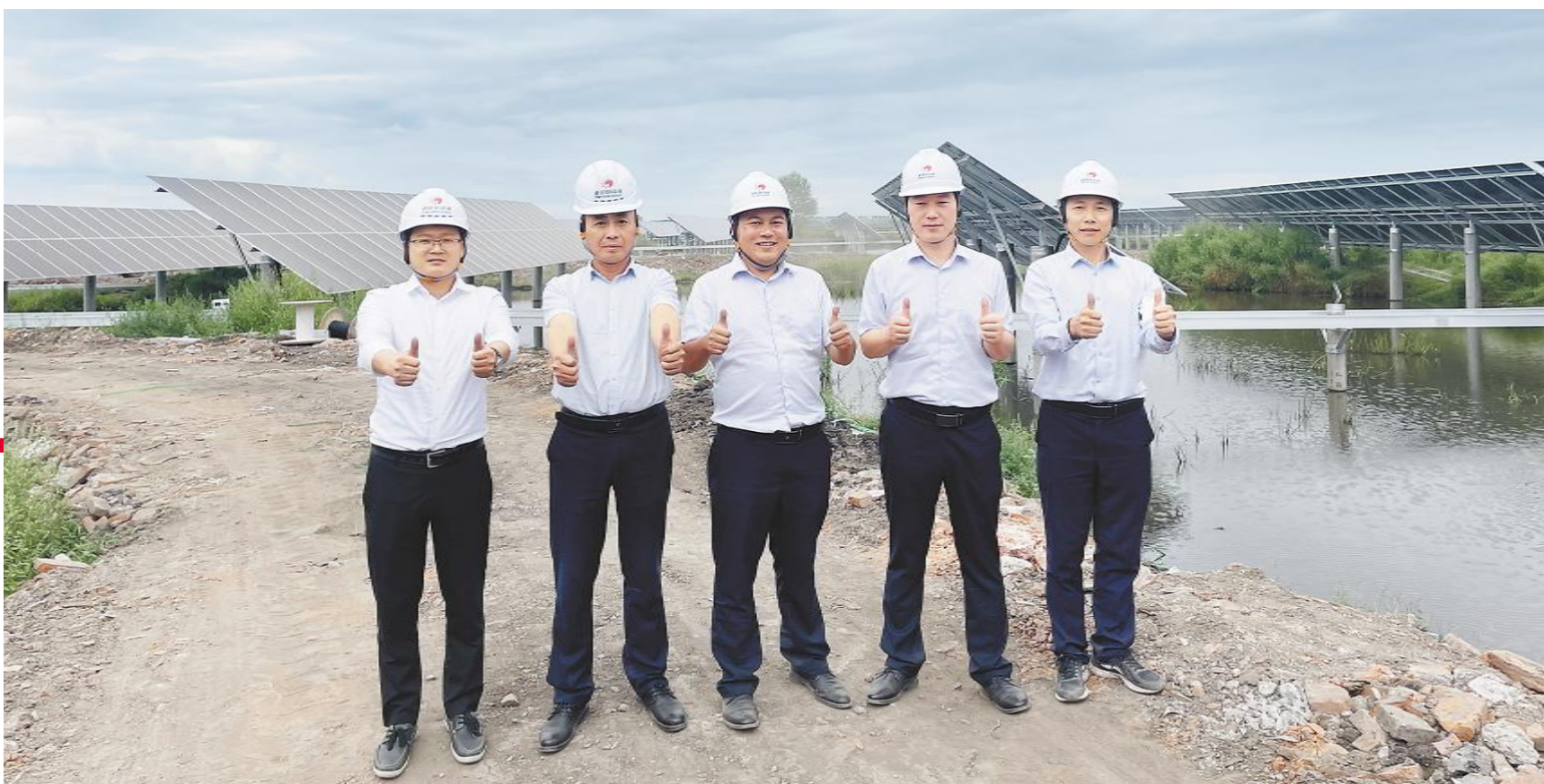
北京新能源绥化项目团队合影