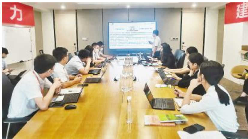
通威新能源举行产品生命周期培训会