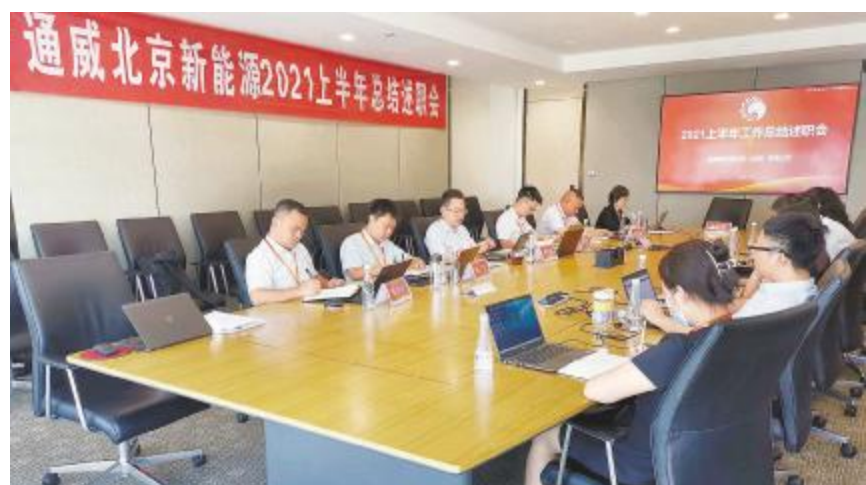
通威北京新能源2021年上半年总结述职会