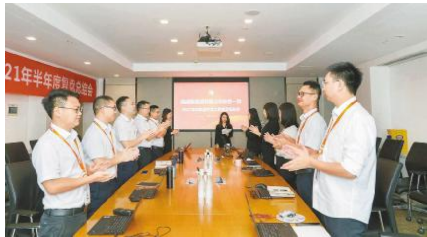
业务一部召开半年度开发、工程复盘总结会

会议明确了公司的重点工作,加强企业文化融合,关注企业文化的宣导,以文化提升格局,以文化统一思想,以文化促进融合;推动工程管理标准化、信息化、数据化升级;大力拓展开发局面,积极争取指标,主动寻求合作伙伴,取长补短,整合资源,实现新发展。