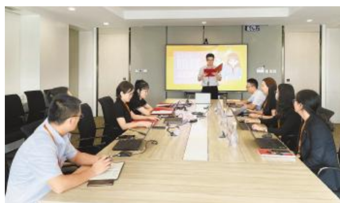
北京新能源演讲比赛现场