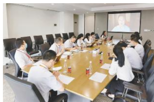
业务二部员工线上参加演讲比赛