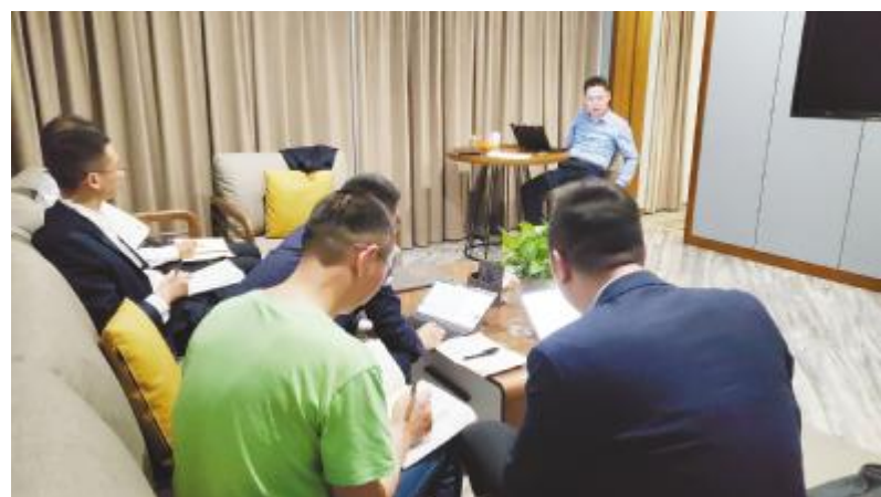
规划方案讨论持续到凌晨两点

绥化项目位于黑龙江省绥化市北林区,由于地处东北,项目所在地的天亮得特别早,不到4点就亮了。在绥化项目流行着一句话:“在项目部加班,加着加着突然天就亮了,这才反应过来,还没睡觉。”这样一个为实现目标废寝忘食的团队是如何炼成的?