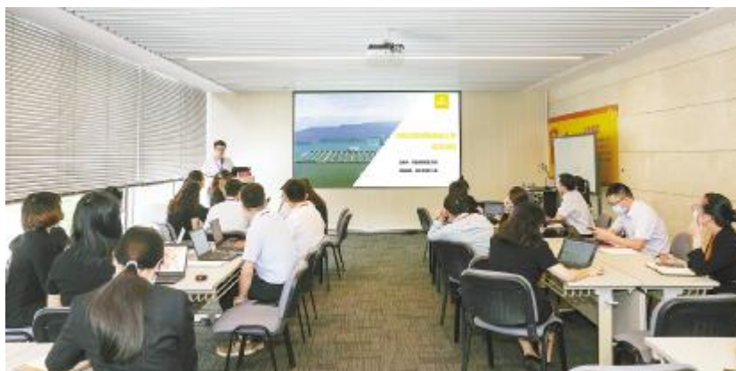
项目开发财务测算模型培训会现场

通过此次培训,进一步提高了参训人员对项目开发财务测算重要性和使用测算工具必要性的认识。大家纷纷表示,今后工作中,将统一思想,合理运用相关工具,为项目落地提供真实有效的事实支撑。