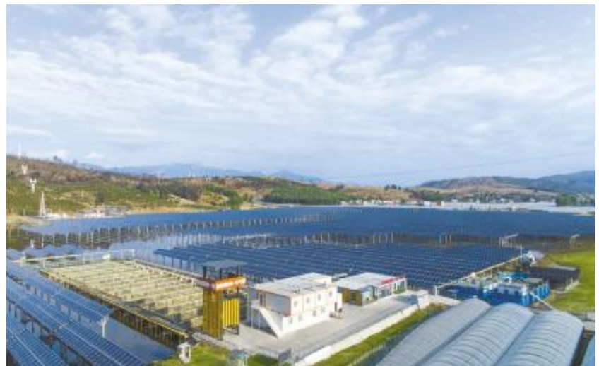
通威西昌“渔光一体”基地

《中国改革报》记者了解到,多年来,通威集团积极推动光伏产业与乡村的融合发展,开创了光伏与渔业协同发展“渔光一体”模式,为新时代光伏参与乡村振兴铺就了一条重要的路径。