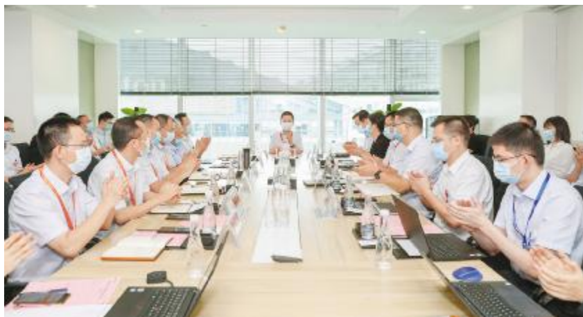
通威股份董事长谢毅与通威新能源管理团队座谈交流

进行沟通交流,并详细了解了开发、建设、运维、养殖、信息化等重点业务的工作情况。邱总汇报了通威新能源的组织架构及重点业务。总部各职能部门汇报了人员编制、部门职能等情况,各业务团队重点汇报了项目开发和建设进度等情况。