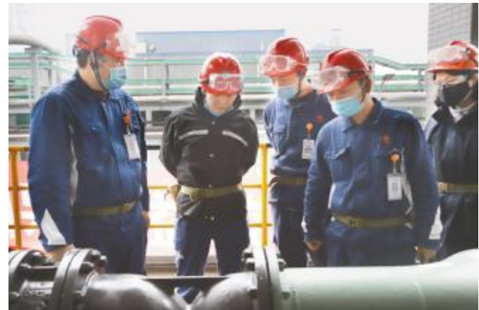
永祥多晶硅组织召开现场办公会