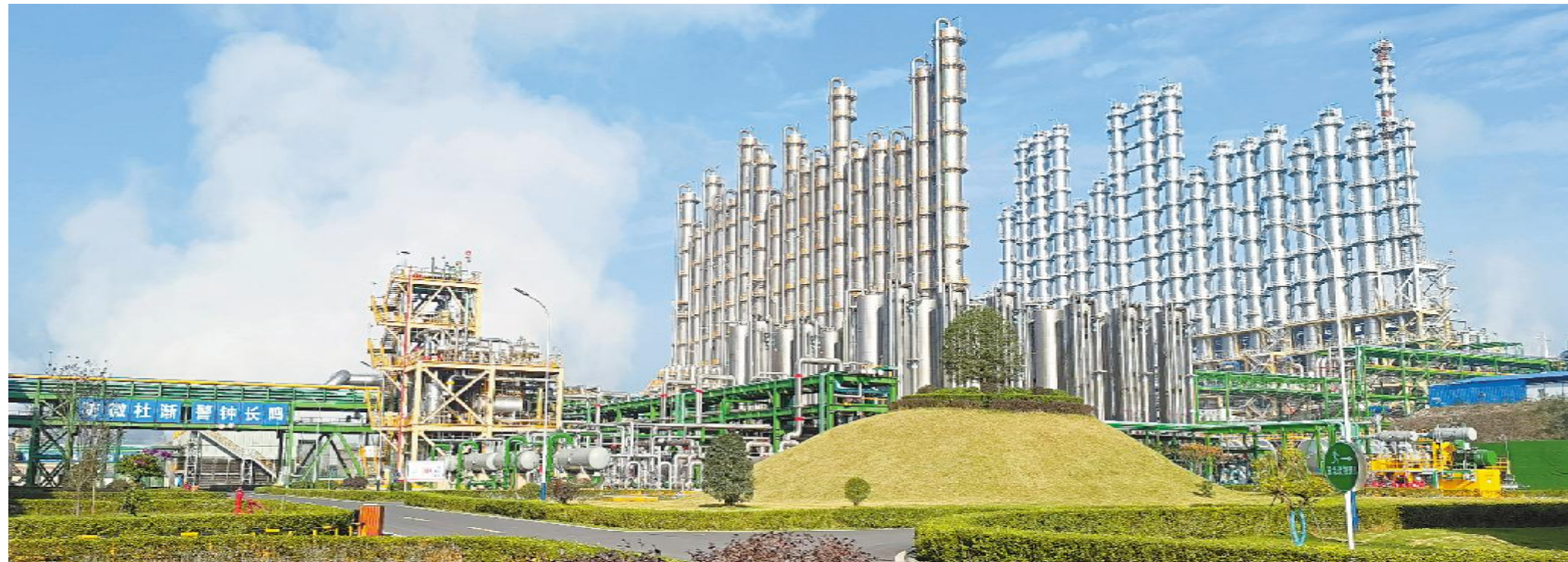
永祥新能源二期厂区