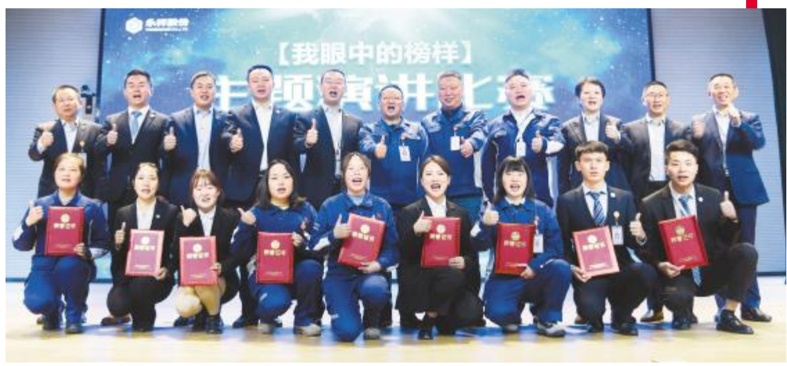
永祥股份2021“我眼中的榜样”主题演讲比赛决赛合影