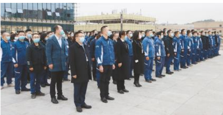
永祥光伏科技首次升旗仪式现场

内审工作不仅是发现问题、改进工作的一个过程,更是保证公司质量管理体系持续、有效、正常运行必不可少的一项工作。永祥新能源将持续深入开展内审工作,引导全员积极参与,助力公司不断发展壮大。