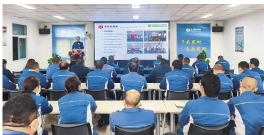
永祥新材料召开百日安全环保活动总结会