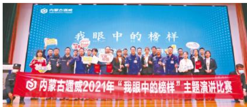
内蒙古通威举行“我眼中的榜样”演讲比赛