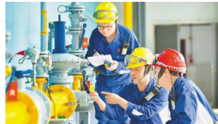
永祥新能源团队检查设备

晶硅的启动,打破了美日欧等国家和地区对中国的“技术封锁”,为电子级多晶硅国产化进程全力提速。每日经济新闻在报道中指出,电子级多晶硅长期被国外企业垄断,永祥新能源二期项目1千吨电子级多晶硅的启动,代表着在中国企业在关键领域“卡脖子”技术上新的突破,在我国集成电路材料“受制于人”的背景下,对我国集成电路产业的发展具有至关重要的战略意义。