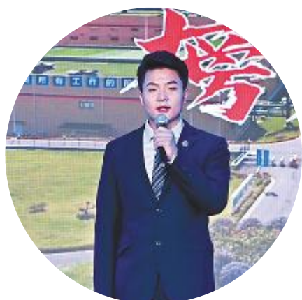
选手莫林精彩演讲