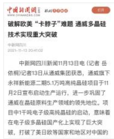
中国新闻网报道截图