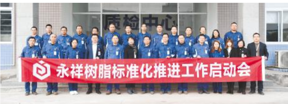
永祥树脂标准化推进工作启动会合影留念