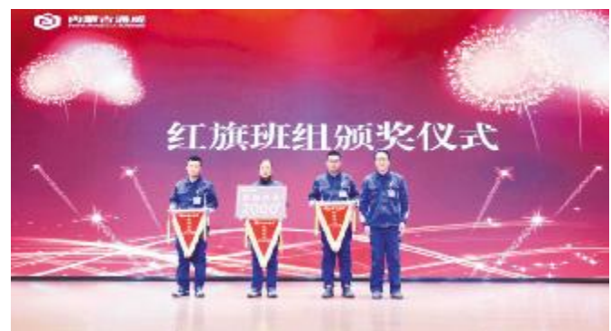
内蒙古通威2021年第五期红旗班组表彰现场

李董强调,没有不可能,只有全力以赴,一切挑战成功都建立在充分准备的基础上,永祥坚持打造精品工程是为了让装置更安全、更稳定、更可靠,为后续生产工作保驾护航。希望全体光伏科技人共同努力,做出成绩,打造通威拉棒行业的一张靓丽名片!