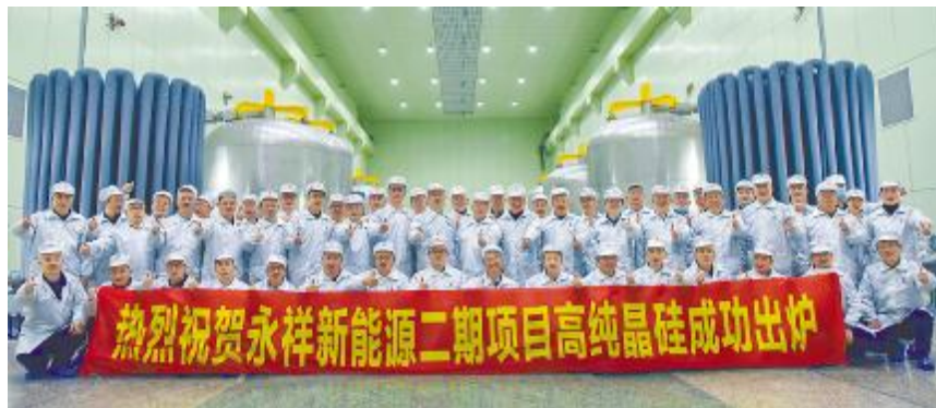
永祥新能源二期项目首批高纯晶硅正品成功出炉

今年,永祥股份经营与基建齐头并进。其中永祥新能源一期、内蒙古通威一期和永祥多晶硅公司保持安全稳定生产,满负荷运行,产品单晶率99%以上,