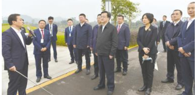
乐山市市委副书记、市长陈光浩一行莅临永祥调研