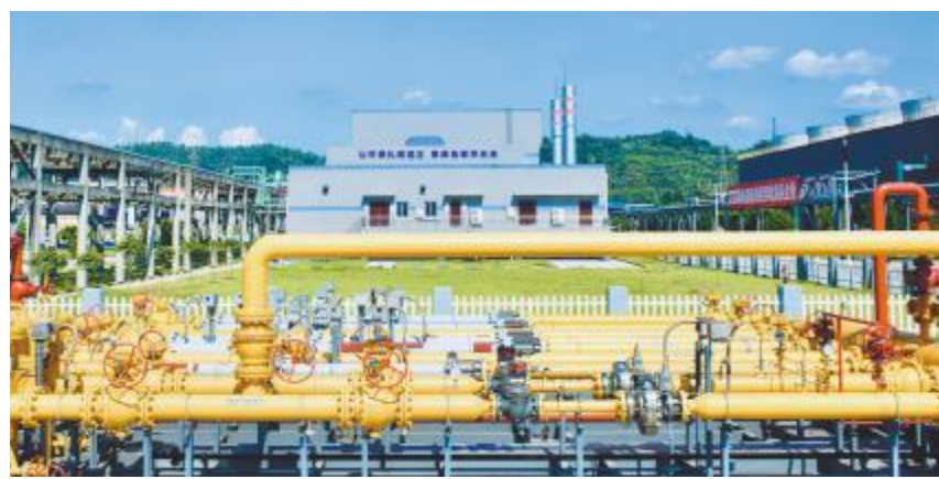
永祥股份燃气锅炉