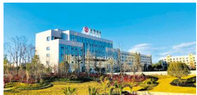
崭新的云南通威办公大楼