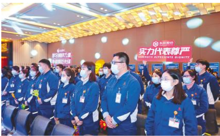
永祥员工代表为参加集团“我眼中的榜样”主题演讲比赛选手助威