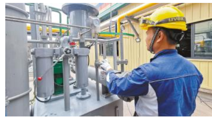
永祥新能源二期现场控制设备参数

媒体在专题报道中指出,永祥高纯晶硅正品的高质量出炉标志着“第六代永祥法”彻底打破了“质量爬坡期”的行业规律,实现了高质量起步,产品一次性即达到领先水平,有力地证明了永祥管理水平、技术研发实力和科技成果转化应用成效,进一步彰显了“改良西门子法”的成熟可靠。永祥新能源二期首批正品一次性成功,也再次夯实了永祥股份全球领先的行业地位。目前,永祥股份已拥有云南保山、内蒙古包头、四川乐山三大基地,2021年底高纯晶硅产能将超过18万吨,预计产能将于2022年达到33万吨。