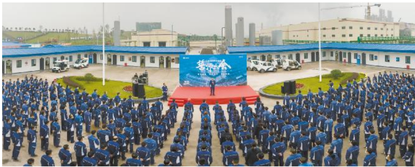
永祥新能源二期5.1万吨高纯晶硅项目调试开车誓师大会现场