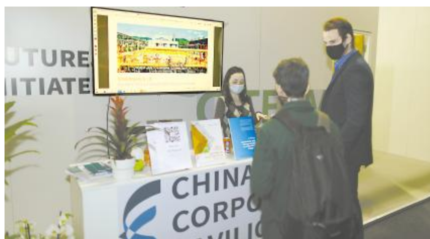
永祥新能源案例在China Corporate Pavilion进行展示