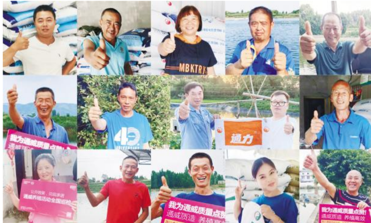
用户对四川通威攻坚克难,保障用户效益的服务精神表示肯定