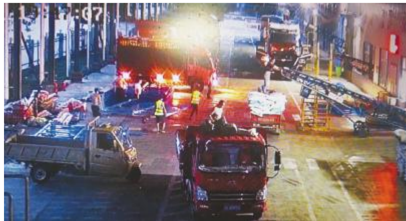
四川通威夜以继日运送饲料,全力保障用户需求

前所未有的高温,不管是养殖企业、动保企业,还是饲料企业,无论规模大小,都在限电范围内,限电停产,全省饲料供应严重不足。缺水、缺水、缺水同时出现,给四川当地的水产、畜禽养殖户们带来了前所未有的严峻考验。