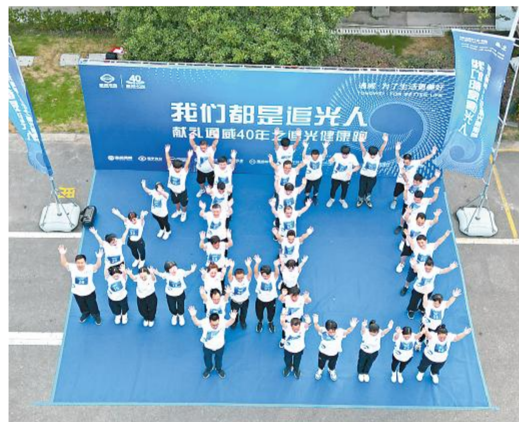
宁波天邦热烈庆祝通威40年华诞