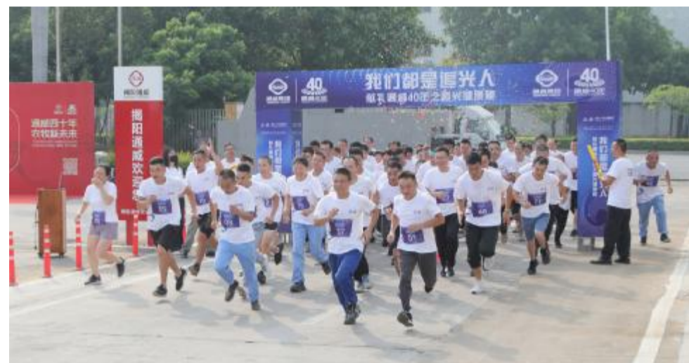
揭阳通威参赛选手闻令而跑