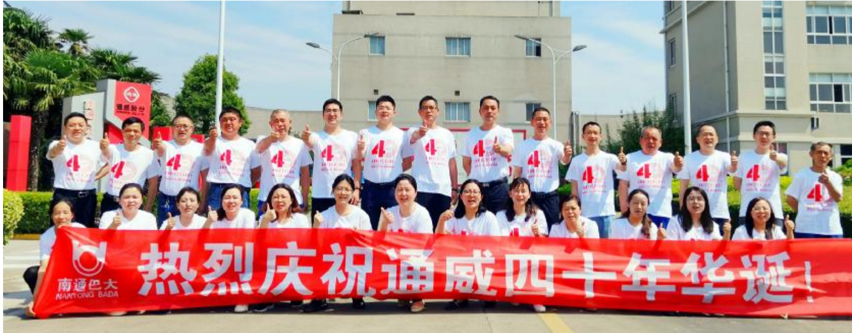
南通巴大热烈庆祝通威40年华诞