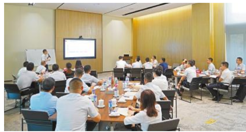
第八届“启航计划”郎酒集团游学活动现场

通过理论讲授、案例分析、课后练习、小组研讨等多种形式帮助启航学员掌握预算管理、财务分析的基本方法和逻辑,逐步引导学员“懂数据、善经营”。课程结束后,在学习中心的辅导下,学员们总结学习要点,结合自身思考积极向公司总经理、直系领导汇报学习心得。汇报学习的同时,也是学员们又一次将所学知识结合公司实际的深度理解。学习中心将持续跟踪学员的学习和应用情况。