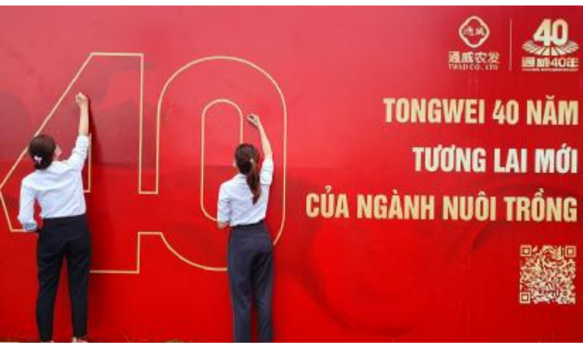
海外片区员工在寄语墙前书写对通威40华诞的生日祝福

通威发端于水产,成长于农牧。通威的发展伴随着新中国改革开放的40年,也是中国民营企业高速发