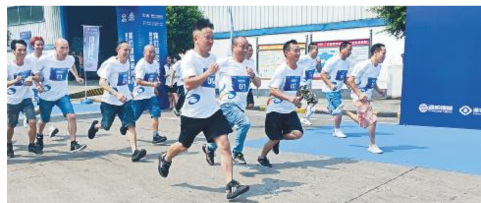
广东预混料参赛选手你追我赶