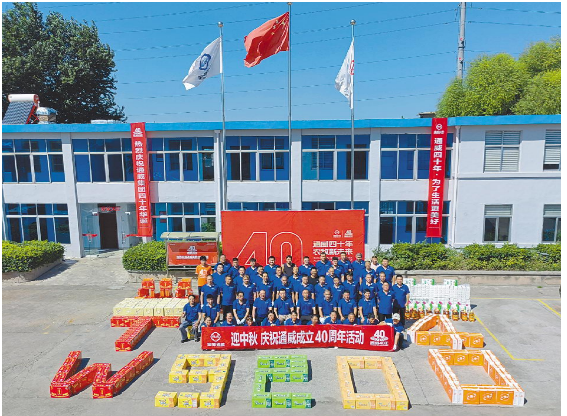
淄博通威为通威40年华诞送祝福