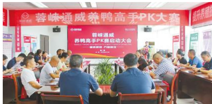
蓉味通威养鸭高手PK大赛隆重召开