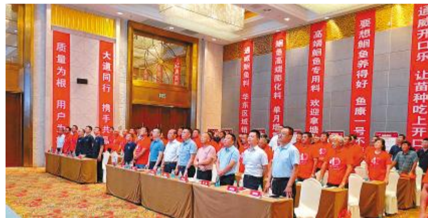
大丰通威开展鲢鱼养殖技术交流会暨鲢鱼养殖技术大比武