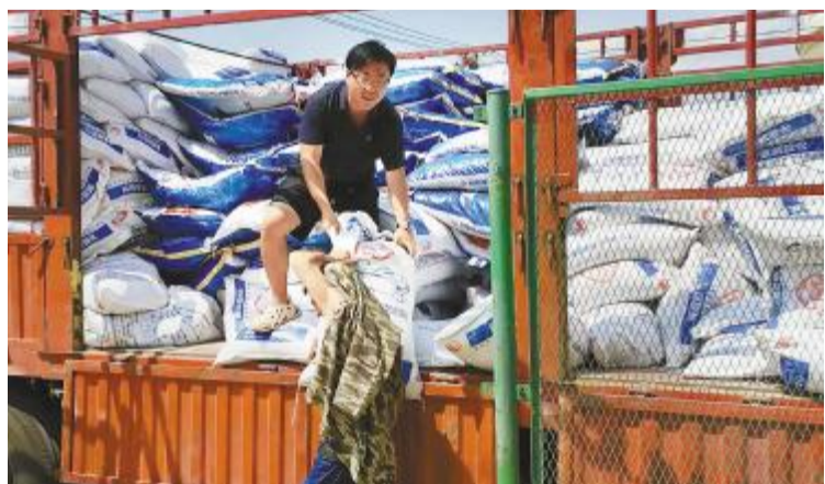
四川通威员工帮助客户及时卸料到塘口