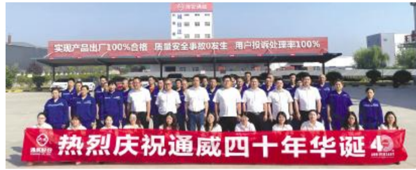
淮安通威为通威40年华诞送祝福

站在2022年,回望过去通威40年的辉煌,眺望未来通威40年的无限可能,通威将以更加坚韧与从容的心态,与价值为伴,于自我突破的同时继续为中国水产行业的转型升级注入新的力量,推动中国由水产养殖大国迈向水产养殖强国,让下一代生活得更幸福。不忘来时路,灼灼赤子心,通威农发一直在路上。