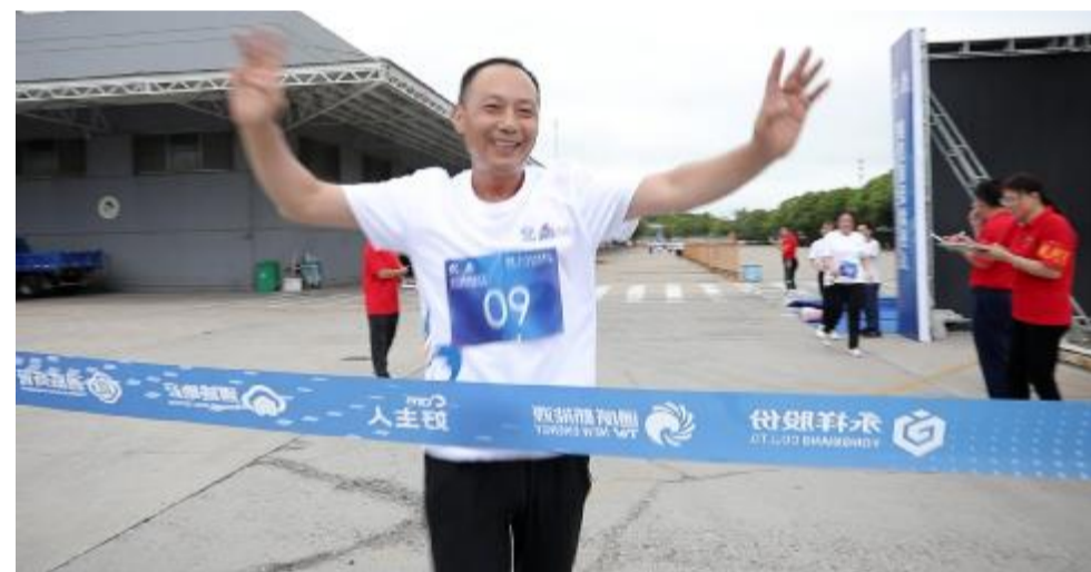
盐城天邦参赛选手冲线瞬间