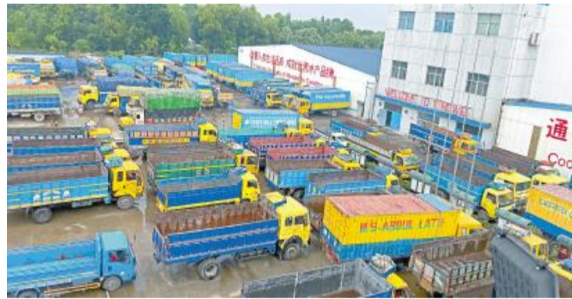
孟加拉通威厂区排满提货车辆,生意火爆

下半年,海外捷报频传,孟加拉通威克服重重困难,1-8月开展主场营销58场,参会人数1528人,塘头会148场,参会人数4232人,转化为通威客户占比51.4%,招商会成功召开2场,现场订货110吨,连续8个月实现正增长,8月销量突破9600吨,全年有望实现27%的同比增长。通威农发用最亮眼的成绩献礼通威40年华诞。