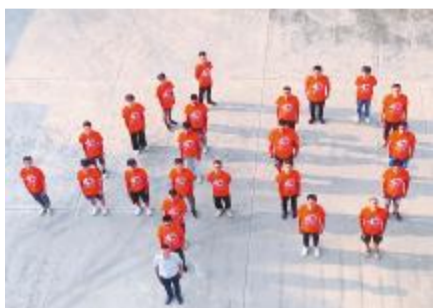
宾阳通威为通威40年华诞送祝福