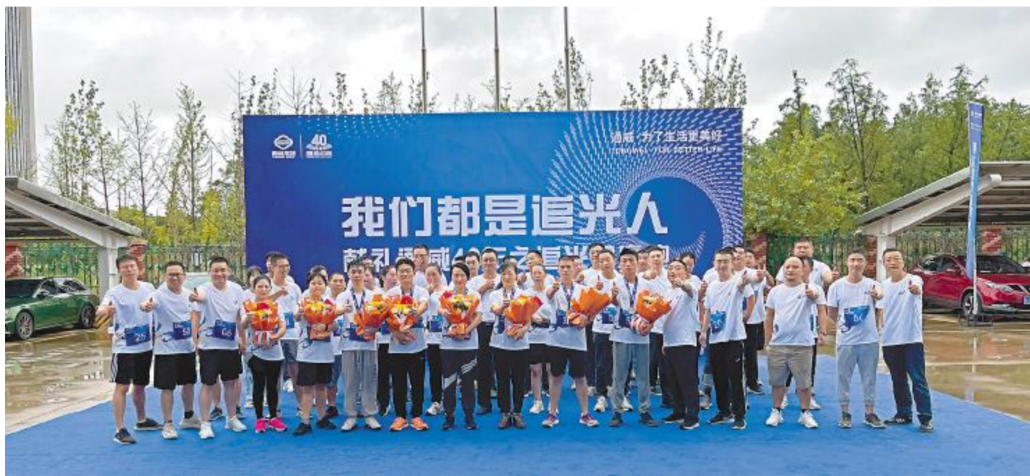
大丰通威开展“追光健康跑”活动,献礼通威40年