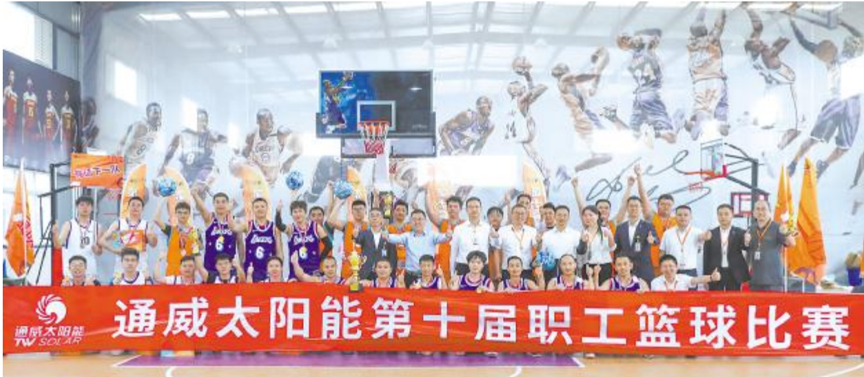
通威太阳能第十届职工篮球比赛合影留念

通威太阳能始终关注员工的身心健康,致力于构建阳光正向的企业文化,打造舒适、活力、和谐的工作环境。各类特色社团活动不仅展现了公司的多元文化风貌,还满足了员工们的兴趣爱好,激发员工积极发挥特长。接下来,通威太阳能将继续组织丰富多彩的社团活动,进一步丰富员工生活,增强团队凝聚力,推动公司企业文化的蓬勃发展。