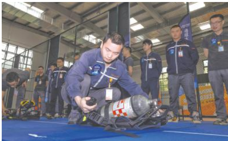
消防技能竞赛现场,选手进行SCBA(压式空气呼吸器)穿戴比赛