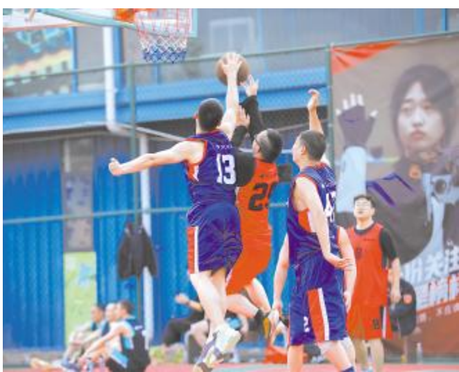
篮球比赛现场,双方球员激烈追逐