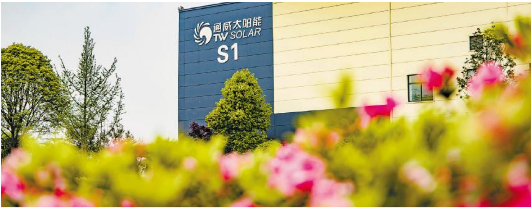
初夏的通威太阳能眉山公司,林木绿意盎然,花草向阳而立

4月30日,随着S5车间首片电池片下线,通威太阳能眉山一期、二期、三期、四期项目全部落地生花,眉山公司的发展也进入里程碑阶段。自2019年3月眉山一期电池项目启动建设以来,5年时间里,五个电池工厂拔地而起。项目全部建成投产后,眉山公司将成为全球单体项目规模最大的晶硅电池生产基地。