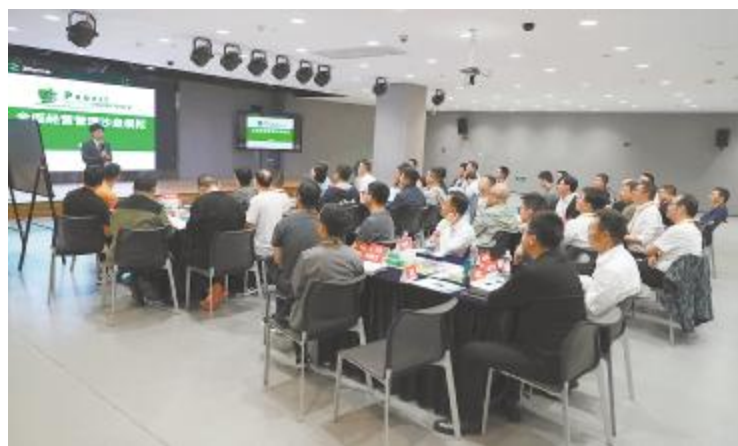
《企业全面经营管理》面授课现场