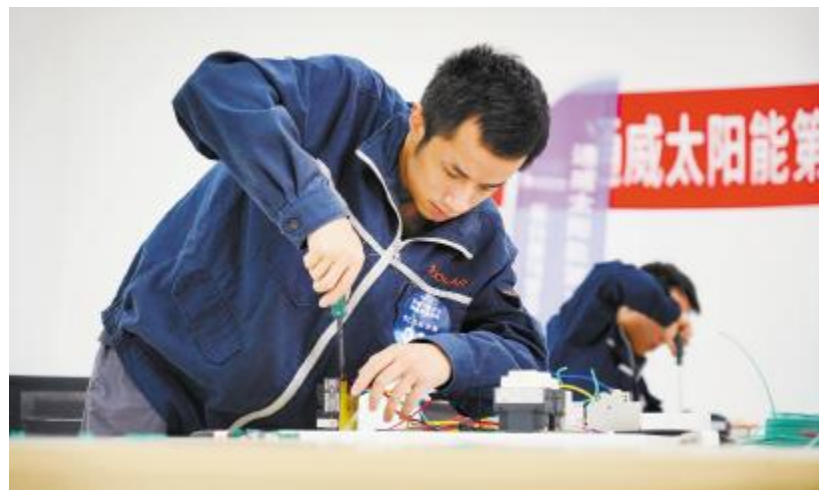
电工技能竞赛现场,选手们冷静地进行电路接插操作