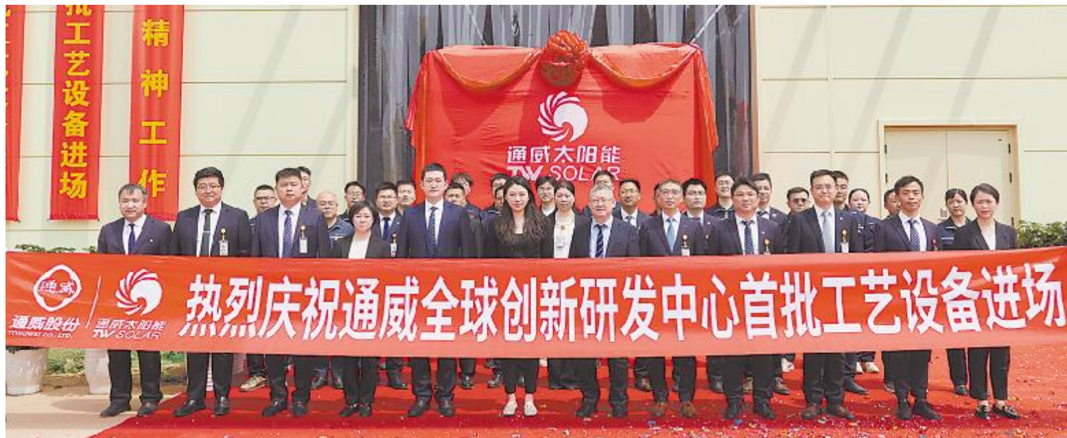
通威全球创新研发中心首批工艺设备进场