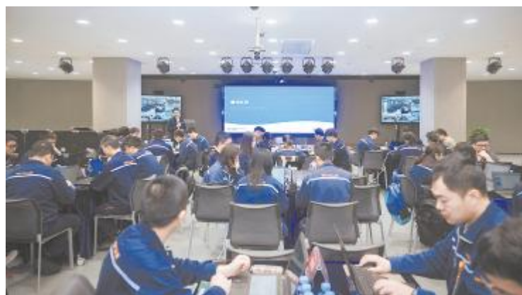
第三期六西格玛绿带培训现场