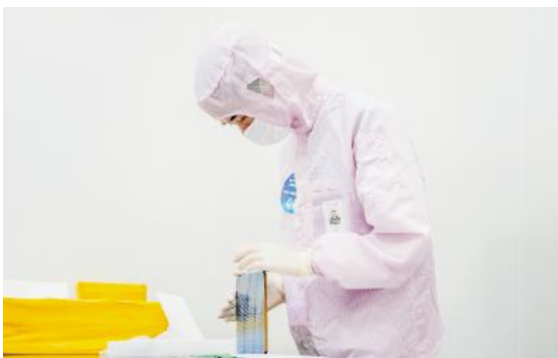
电池片检验技能竞赛现场,选手全神贯注对电池片数量进行清点