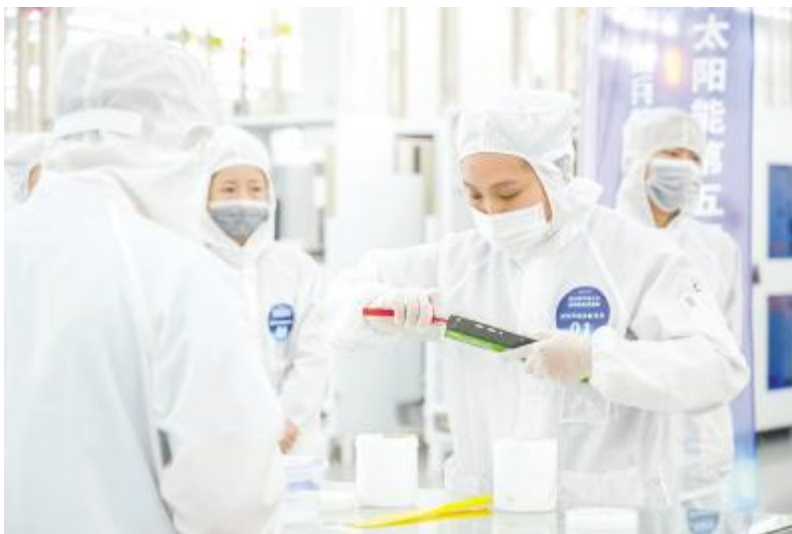
刮浆料桶技能竞赛现场,选手在评委的注视下沉着应对比赛

强化业务水平,夯实人才基础。通威太阳能一直以来高度重视培养和选拔高技能人才,一方面通过系统化的培训与技能评定选拔工匠人才,另一方面通过组织员工参加形式多样的内、外部赛事,以赛促学、以赛验学,全力打造一支知识型、技能型、创新型的优秀团队,为巩固公司“精益生产”管理基础,推动公司高质量发展提供坚实的支撑。