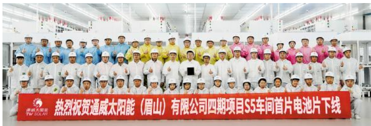
眉山公司四期项目S5车间首片电池片下线

座谈期间,美的集团相关业务负责人就美的在自动化领域的探索、数字化转型的实践案例做了分享。双方围绕美的智慧供应链解决方案、IPD(集成产品开发)经验、人工智能在工业领域的应用场景、未来工业发展的趋势和挑战等话题进行了深入交流。