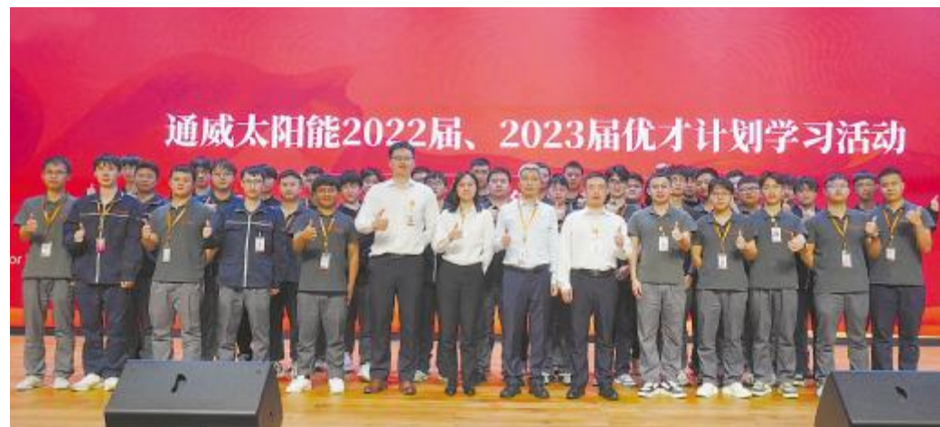
优才生学习交流活动现场