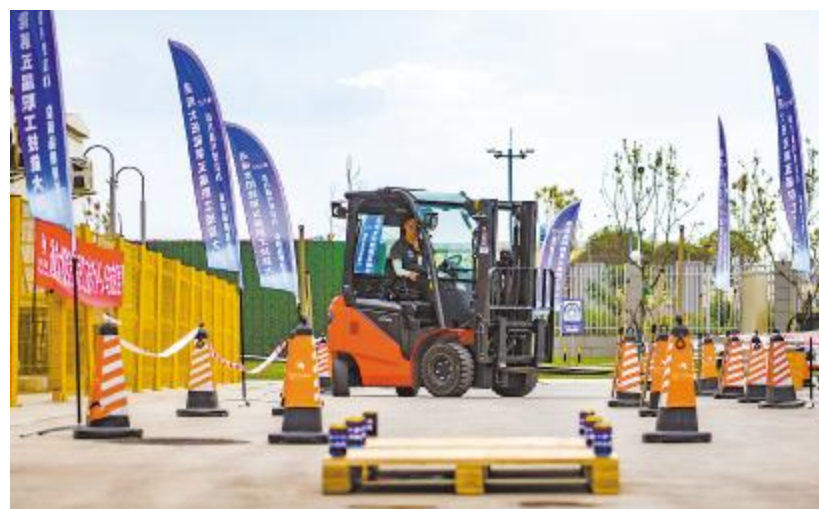
叉车技能竞赛现场,选手熟练驾驶叉车进行绕桩作业