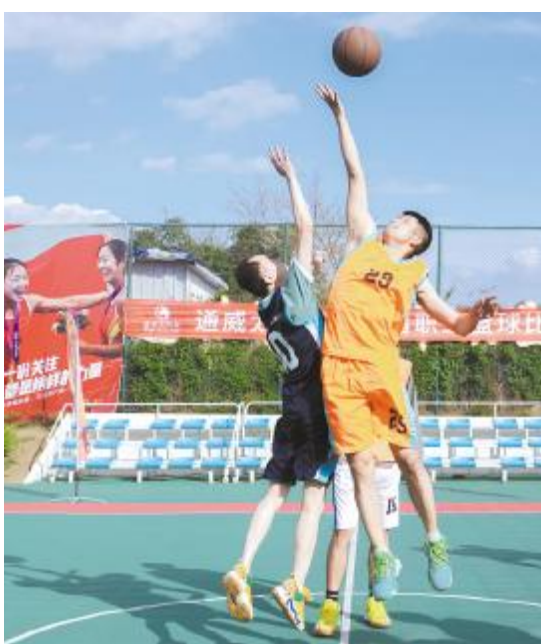
球员激烈拼抢,争夺球权