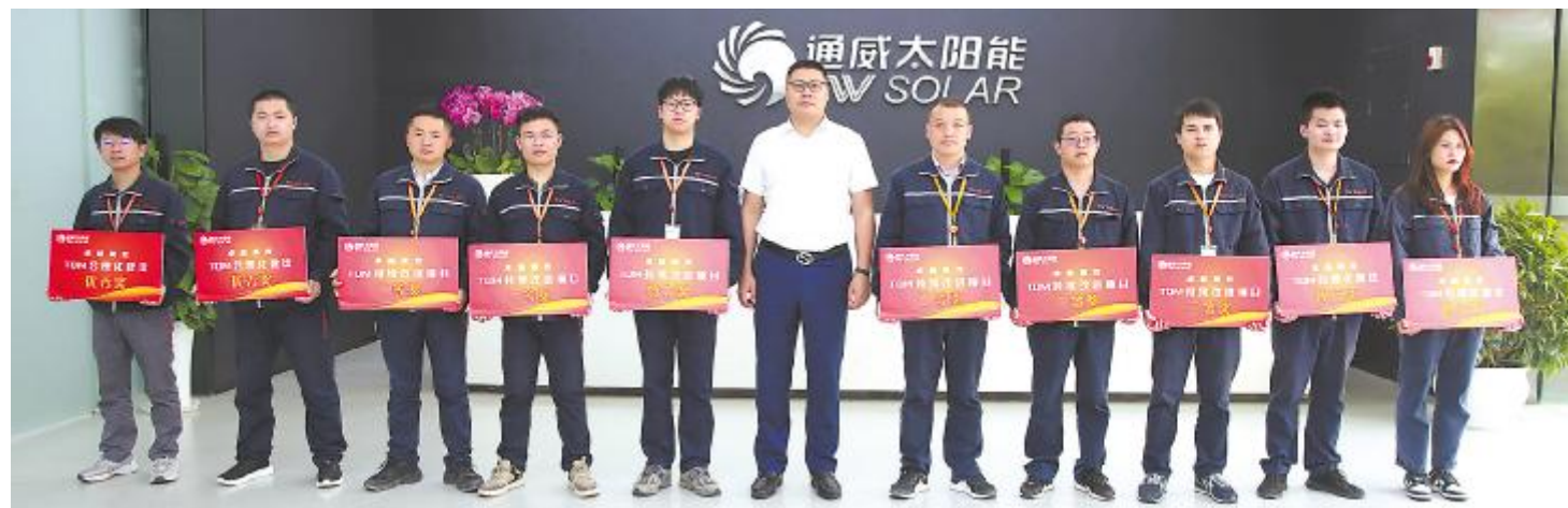
第一季度TQM提案项目表彰大会

本次活动创新地融合了课题研究 with 车间现场实践,为优才生们搭建了一个互动交流、共同学习的平台。优才生们对此次活动的反馈积极,他们表示收获颇丰,并期待着下一次学习交流活动的到来。通威太阳能优才计划作为生产高级管理人才后备梯队培养项目,旨在通过厂长带教、工作实践、跨基地轮岗学习等培养模式,培养一批熟悉生产制造流程、有经营意识,同时对前沿技术有所了解的复合型管理人才。