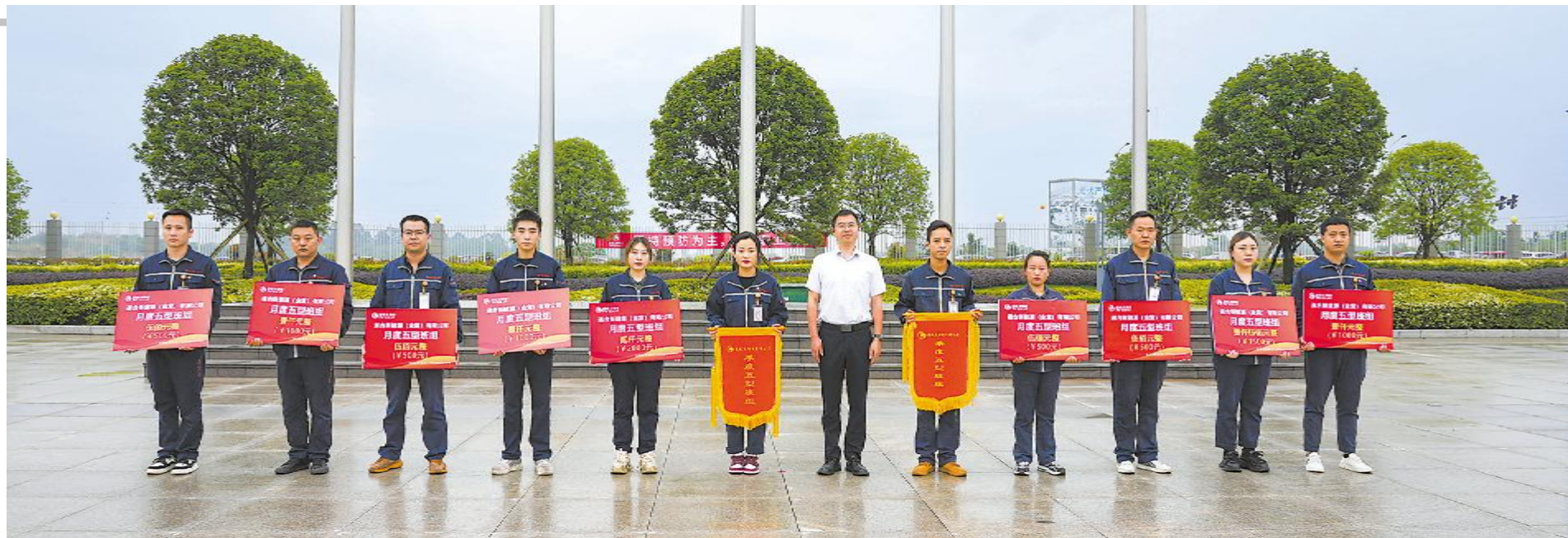
3月月度五型班组及第一季度五型班组表彰现场