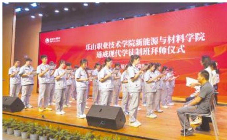
乐山职业技术学院通威现代学徒制班拜师现场