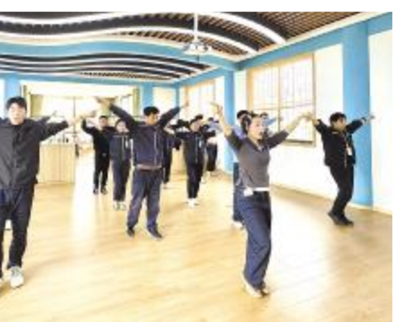
健身社团邀请外部老师进行健身课堂教学