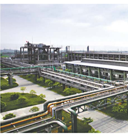
永祥多晶硅硅厂一期建设过程

企业文化是一个不断发展和变化的过程。企业文化建设的第一步是建立一套真正体现企业价值和企业文化的经营理念和管理程序,可以充分发掘员工的积极性和创造性,并自觉地把握力度和适度。如果企业文化并没有建立起来,可以断言,这样的企业文化建设就是一个没有灵魂的躯壳。