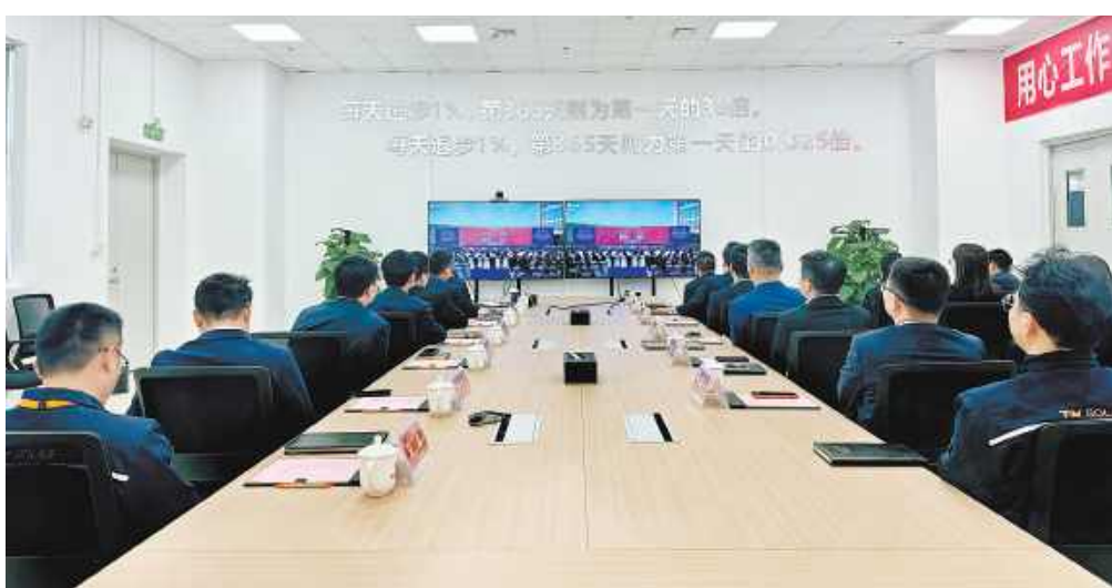
通威太阳能科技南通基地收看集团企业文化启动仪式视频直播

刘汉元主席指出,通威自己独有的企业文化,完完全全立足于以前走过的路、做过的事,并在此基础上的梳理和总结,而不是从别人那里拿来套在我们身上的一件“外衣”。一直以来,通威太阳能科技植根文化沃土,传承发扬,不断创新形式,让通威文化在各大新基地落地生根,在新员工中萌芽。为发挥文化引领作用,3月以来,通威太阳能科技组织开展员工生日会、主题征文活动、节日送祝福、趣味竞赛等形式多样的文化活动,丰富员工文化生活,凝聚齐奋进、共奋斗的向心力和战斗力。