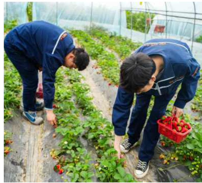
采摘草莓,享惬意生活

通威太阳能科技一直致力于打造温馨、和谐的工作环境,注重员工的成长与福利。未来,公司工会也将持续创新关怀模式,丰富文化活动形式,与员工共奋斗、同分享,助推公司高质量发展。