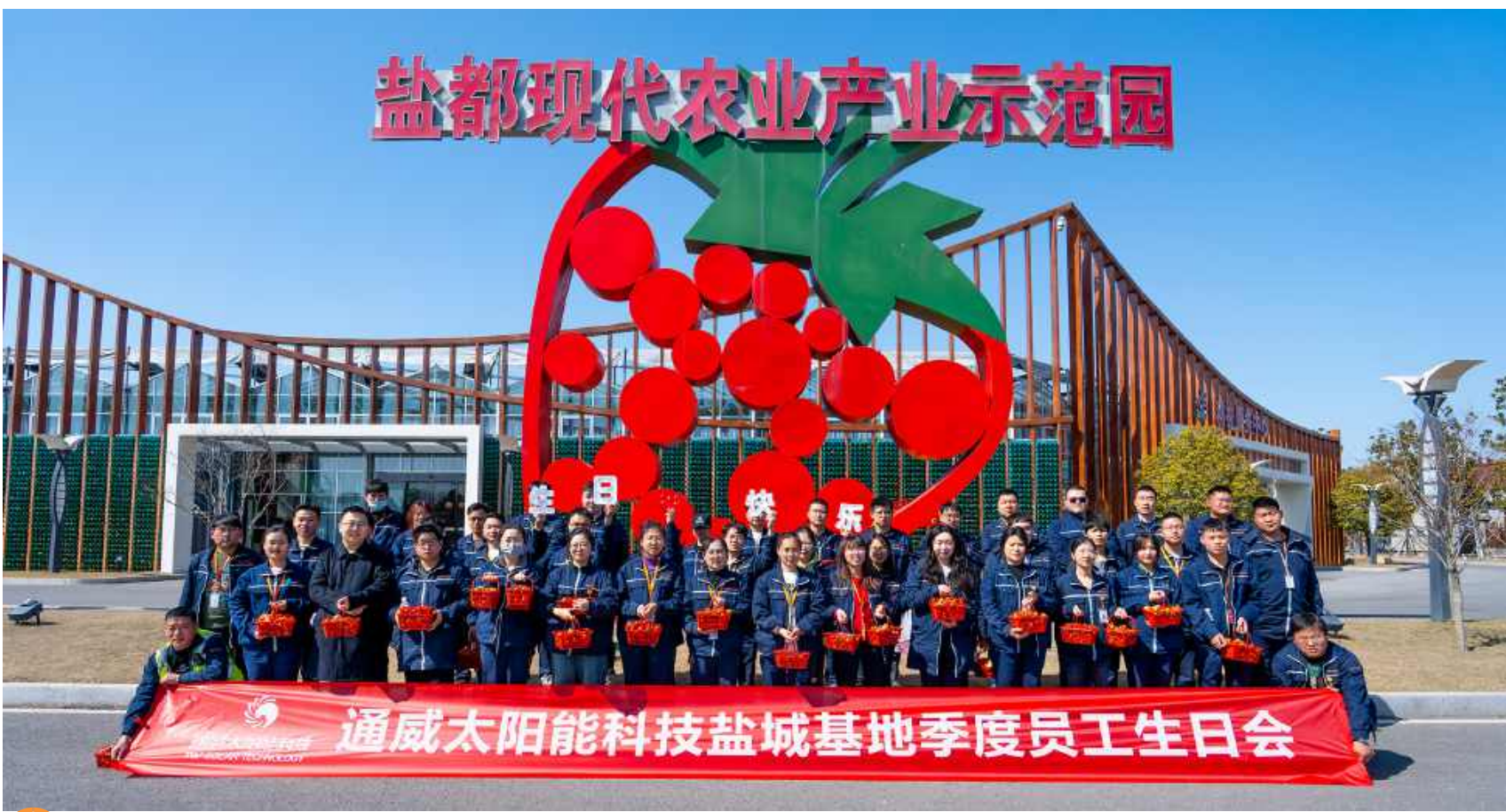
通威太阳能科技一季度员工生日会盐城基地合影留念