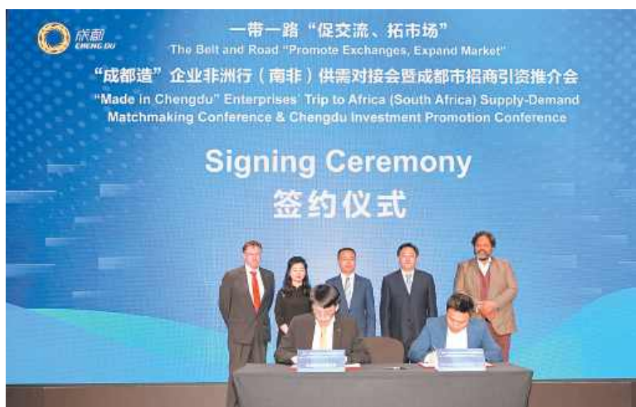
通威与海兴电力签署150MW高效组件采购协议