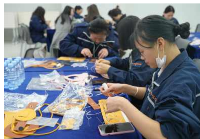
金堂基地开展妇女节手工制作活动