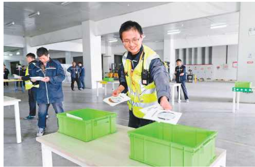
通威太阳能科技固废分类竞赛活动合肥基地现场