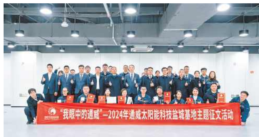
盐城基地“我眼中的通威”主题征文活动决赛合影留念