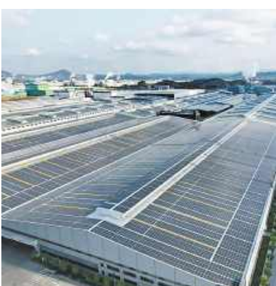
通威高效组件助力广西藤县蒙娜丽莎85MW综合智慧能源项目并网

中信博是全球领先的光伏跟踪支架、固定支架及BIPV系统制造商与解决方案提供商,在BIPV领域推出智顶、双顶、脊顶及捷顶四大创新解决方案。通威高效组件与四大创新解决方案均可完美适配。此次藤县蒙娜丽莎85MW综合智慧能源项目成功并网,不仅刷新了华南BIPV项目的装机规模,也为全国大型分布式光伏项目建设提供创新应用模式。