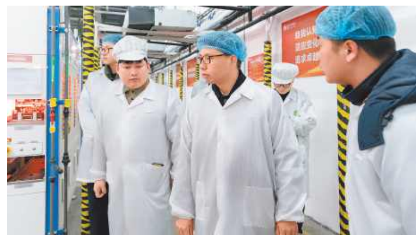
合肥基地开展月度综合安全检查