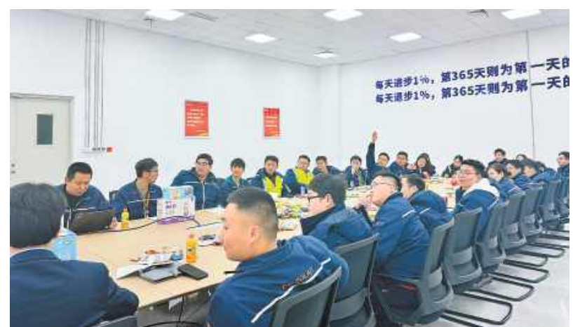
南通基地举行各培养班学员及导师座谈会