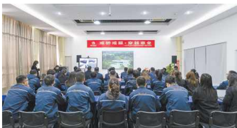
通威太阳能科技合肥基地活动现场

验收专家组听取了合肥基地整体汇报,审阅了公司相关资料,对具体内容进行了质询和讨论。验收专家组还前往项目车间进行实地考察,对项目高效自动化设备和高端数字化软硬件的引入以及规范严谨的现场管理给予高度评价。最后,验收专家组一致认为,公司项目达到建设目标,总体完成各项投资,资金使用符合经费管理制度,经济和社会效益显著,验收资料齐全、真实,符合验收要求,同意该项目通过验收。