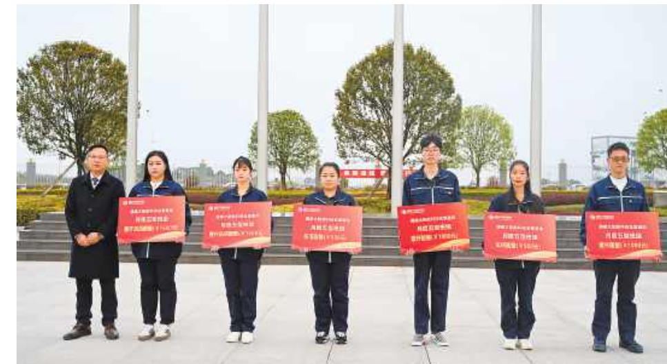
金堂基地表彰月度五型班组

随着员工法律意识的逐步加强,企业面临的劳动风险也日益复杂和多样化,为保障企业的稳定发展和员工的合法权益,企业风险管理越来越重要。通过本次全面的法律知识赋能,进一步强化了风险防控,促进合规管理,为公司的稳健发展保驾护航。