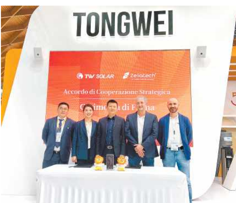
通威与 Zeliatech 签署 250MW 合作协议