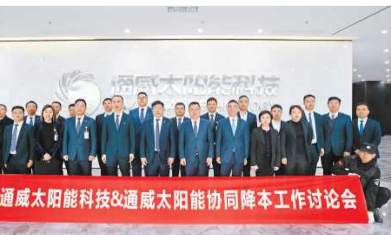
通威太阳能科技 & 通威太阳能召开协同降本工作讨论会议

萧总表示,通过充分的讨论,双方达成了“拧成一股绳的力量,才能拥有更具竞争力产品”的共识。通威一直秉持产品质量第一的理念,要通过创新技术,把新技术、新产品、新工艺等应用到生产经营中,不断