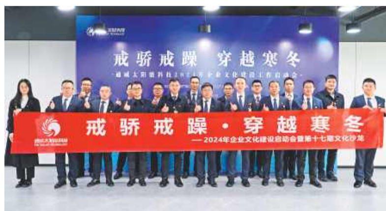
通威太阳能科技盐城基地合影留念