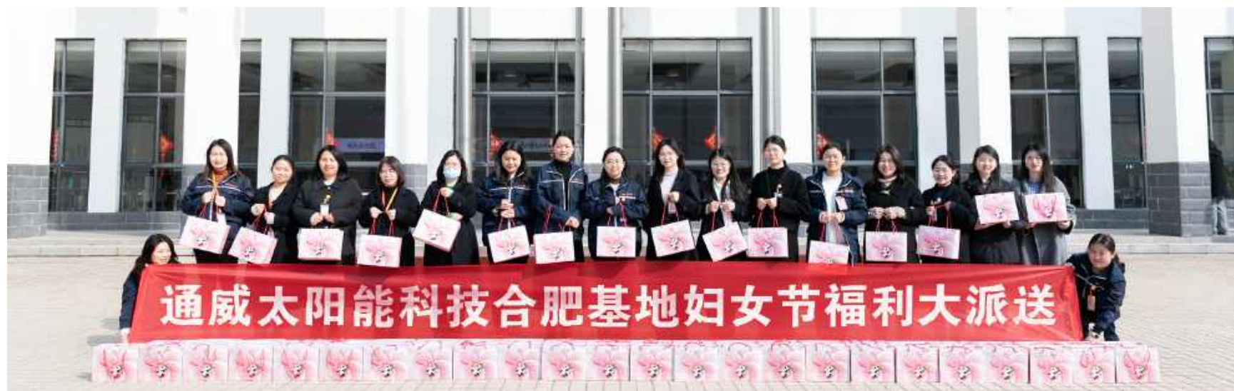
通威太阳能科技妇女节主题活动合肥基地合影留念