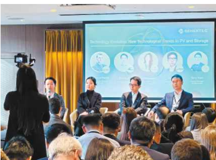
通威出席中意新能源合作论坛

一系列的合作成果,并非一蹴而就,而是双方基于对彼此的详细了解。各合作方通过营销平台、线下展会等多种渠道,全面深入了解了通威的组件产品,对通威智造、服务的高度肯定,为合作打下了坚实基础。