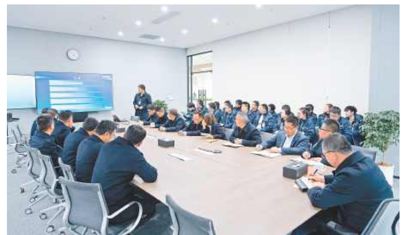
盐城基地举行月度安全环保会议