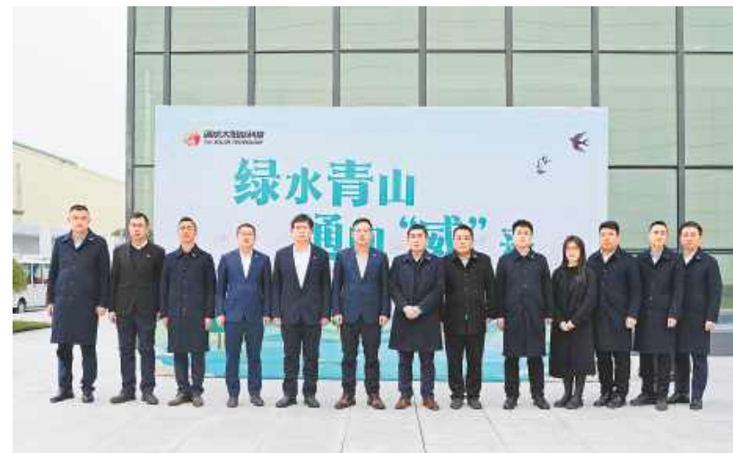
通威太阳能科技2024年环境保护月启动仪式金堂基地合影留念