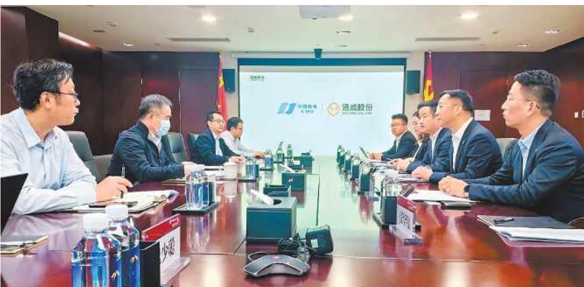
通威股份光伏商务部与中国华电集团物资公司座谈交流