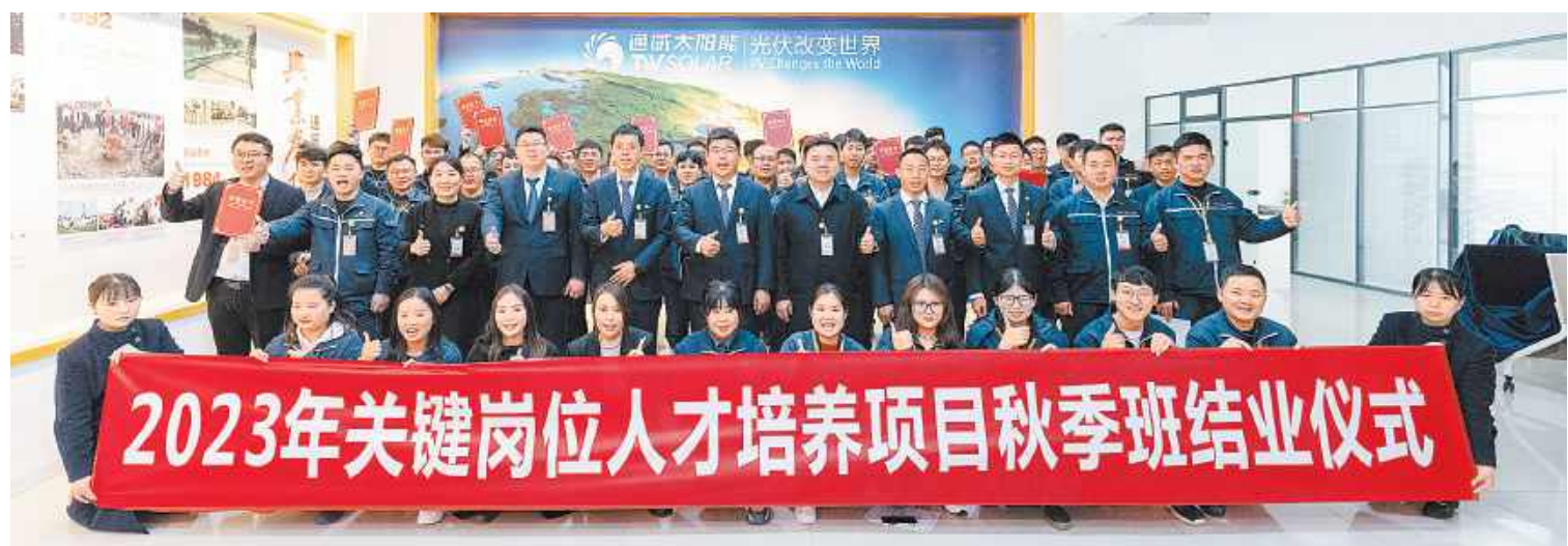
通威太阳能科技2023年关键岗位人才培养项目秋季班结业仪式合肥基地合影留念