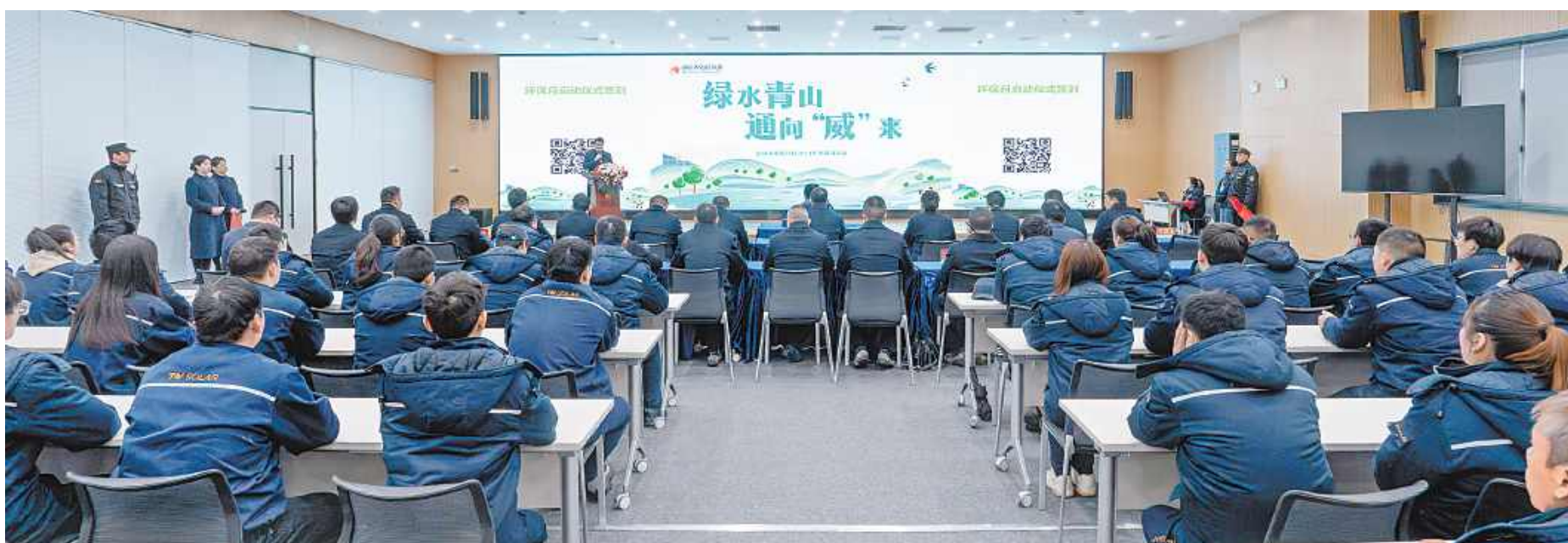
通威太阳能科技2024环境保护月盐城基地启动仪式现场

通过开展学员与导师座谈会,深度了解各培养班学员的工作及学习情况,强化学员与带教导师之间的高效沟通,助力培养班学员成长发展。